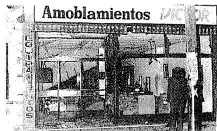
Hora 1:30. Gral. Flores 2542 y Concepción Arenal: estalla una bomba que provoca graves daños