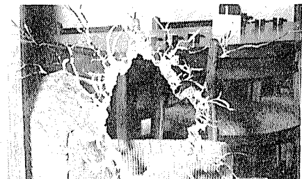
Hora 3:15. Agraciada 2322: disparos de grueso calibre