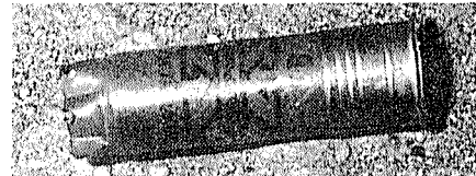
Cartucho de guerra fotografiado por JAQUE veinte minutos después del último atentado.