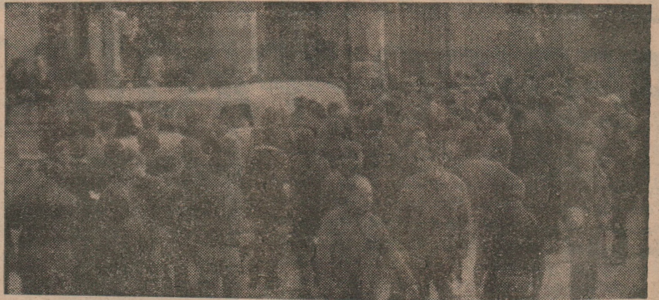
Llega al Liceo 8 el furgón con el cuerpo del compañero Rodríguez.