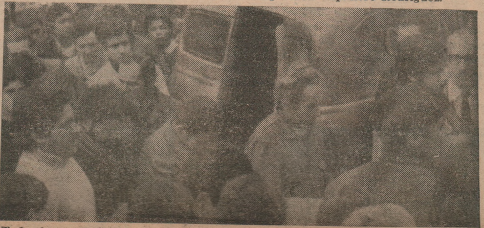
Todos los compañeros pugnan por llevar el féretro de otra víctima del fascismo

ha pasado nos llena de indignación. No es posible que se asesine impunemente, y que las fuerzas policiales y del Ejército nunca puedan detener a los fascistas".