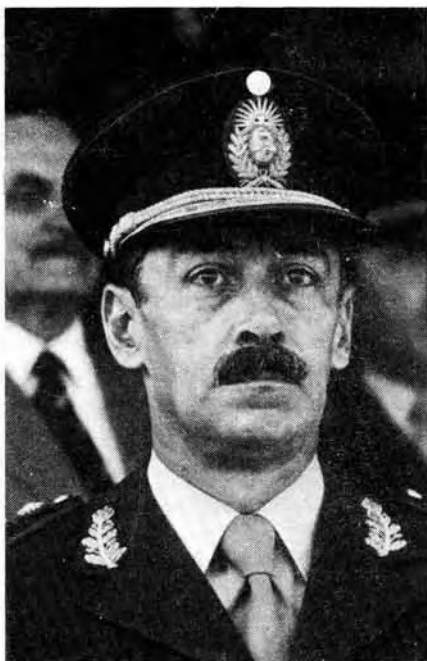
Jorge Rafael Videla

"Asumo, en cambio, mi injusta condena como un acto de servicio que, con fe en Dios, Nuestro Señor, ofrezco a mi Patria, al Ejército y a todo el pueblo argentino." ■