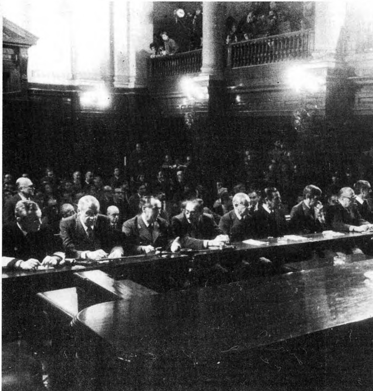
La opinión pública ya juzgó a los nueve ex comandantes acusados, según datos de una encuesta en Capital.