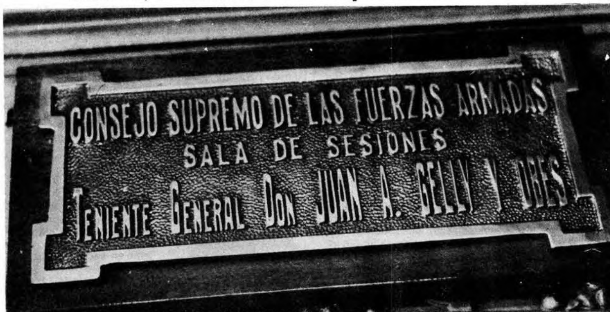
Detrás de esta placa, el hermetismo, el silencio, la desinformación. Malvinas en manos de la justicia militar.

Las restricciones que el más alto tribunal militar ha impuesto a la prensa que pretenda cubrir las audiencias de lectura de cargos a los responsables de Malvinas, sólo ocultan una voluntad de impedir informar a la ciudadanía.