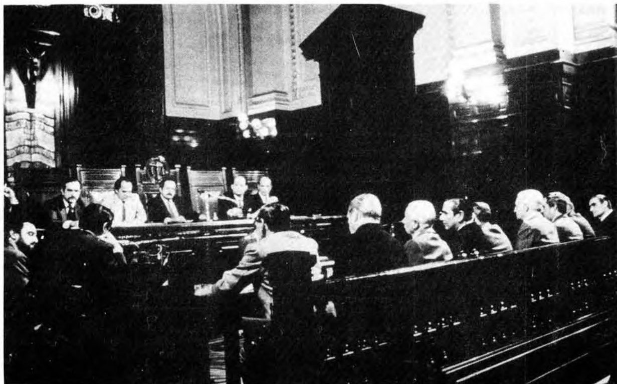
El primer día del alegato del fiscal Strassera. Los ex comandantes del proceso escuchan, frente a la Justicia.

con una especie de coraza para no dejarse impresionar por lo que sabían iban a escuchar, pero pese a ello hubo testimonios que los conmovieron", me confesó tiempo atrás una fuente de la cámara refiriéndose a los magistrados.