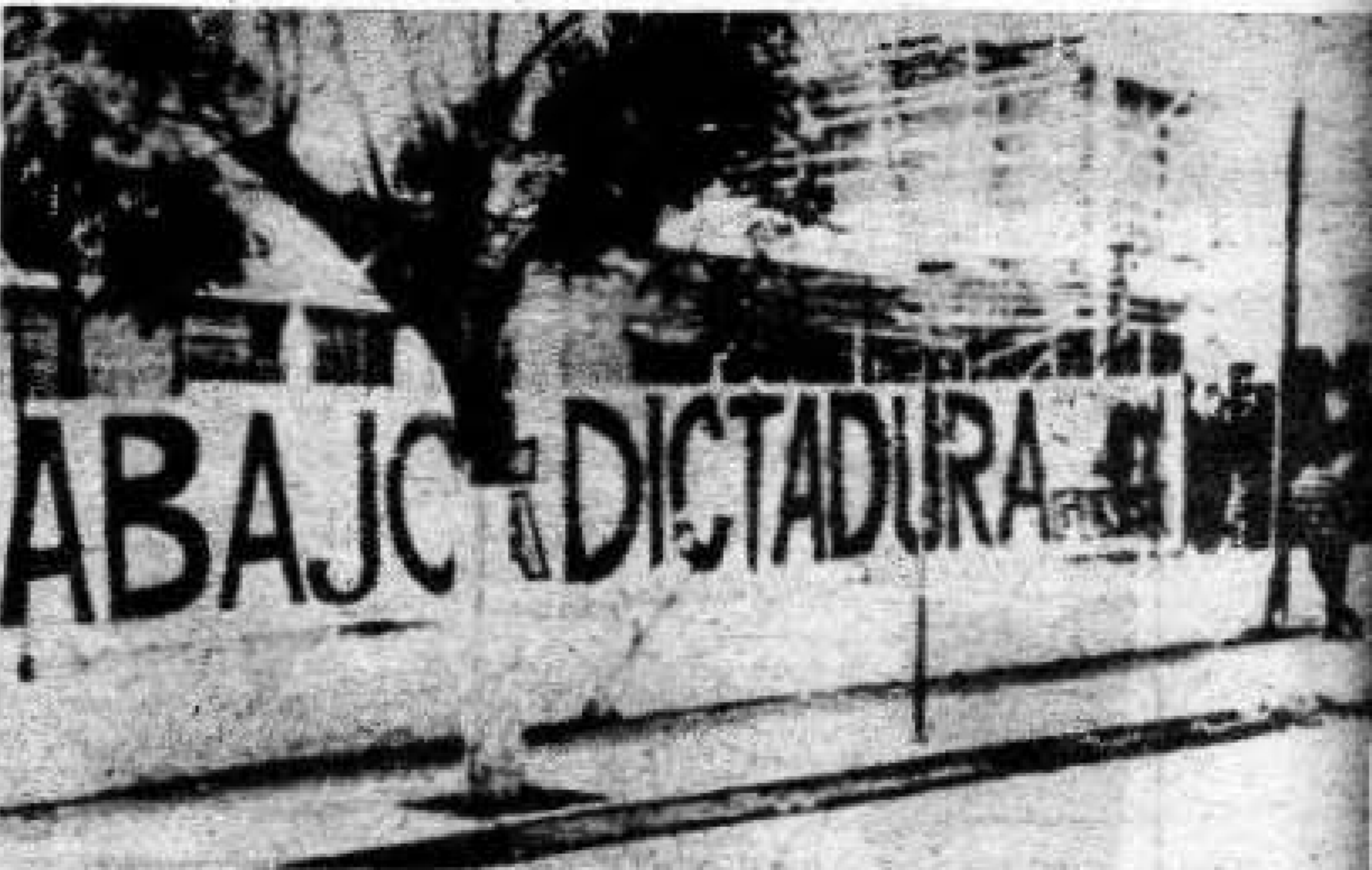
Respuesta al golpe de estado de junio de 1973, huelga general y manifestaciones.