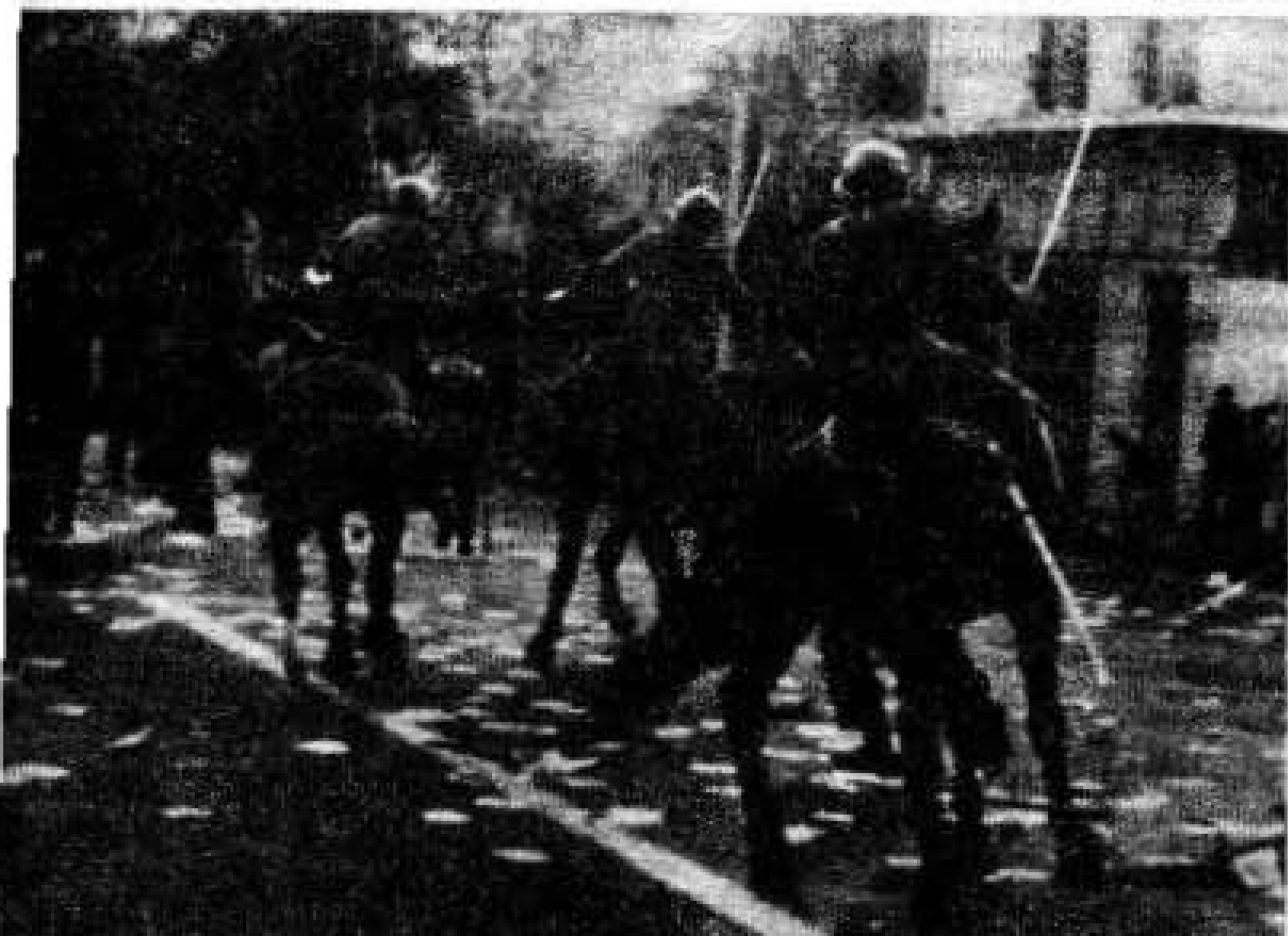
La "montada" contra el pueblo.

Uruguay queda reducido así a un apéndice de la política y los intereses brasileño-norteamericanos. Todo esto acentuado por la