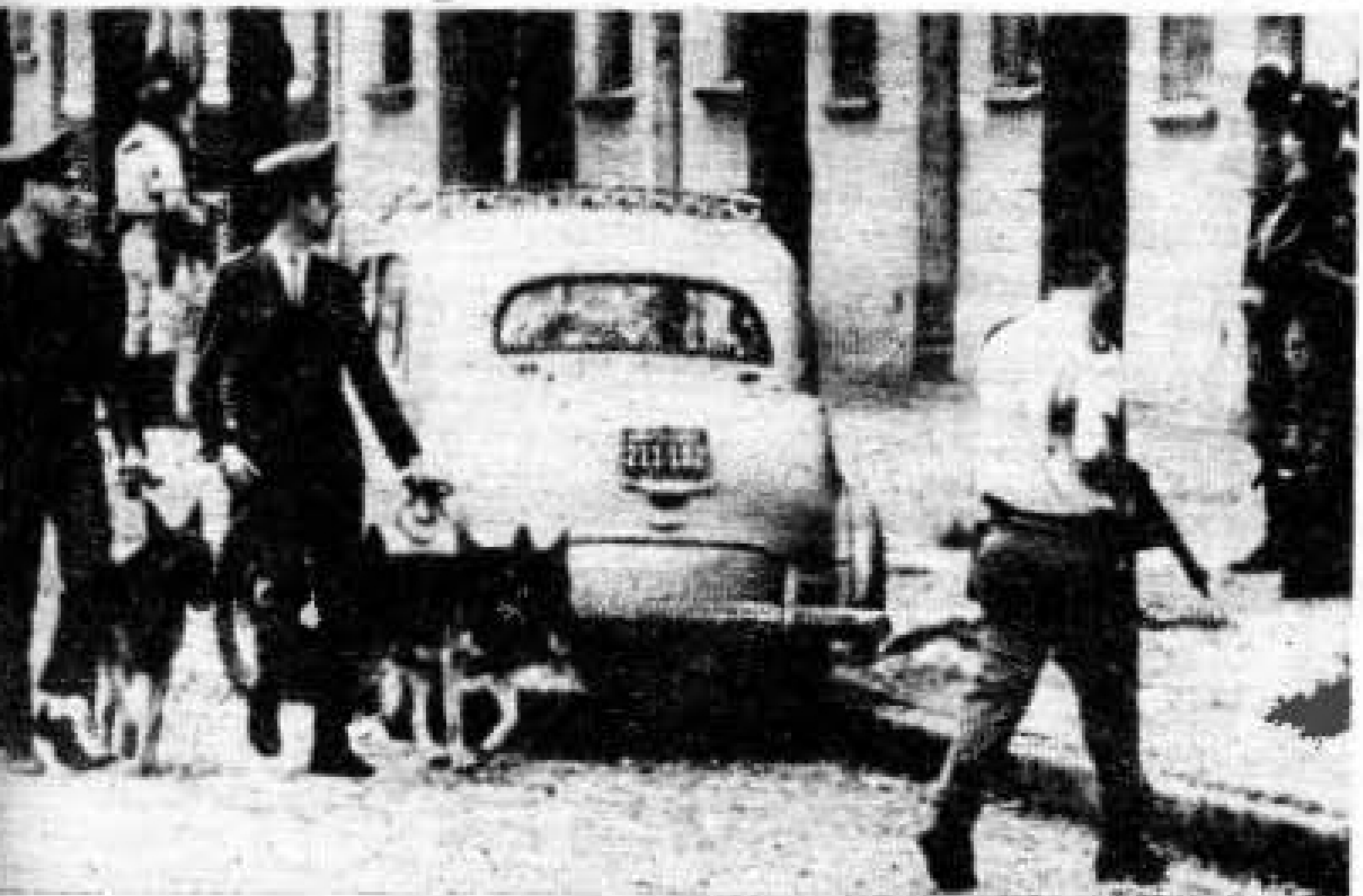
Perros especialmente adiestrados para la "caza del hombre".