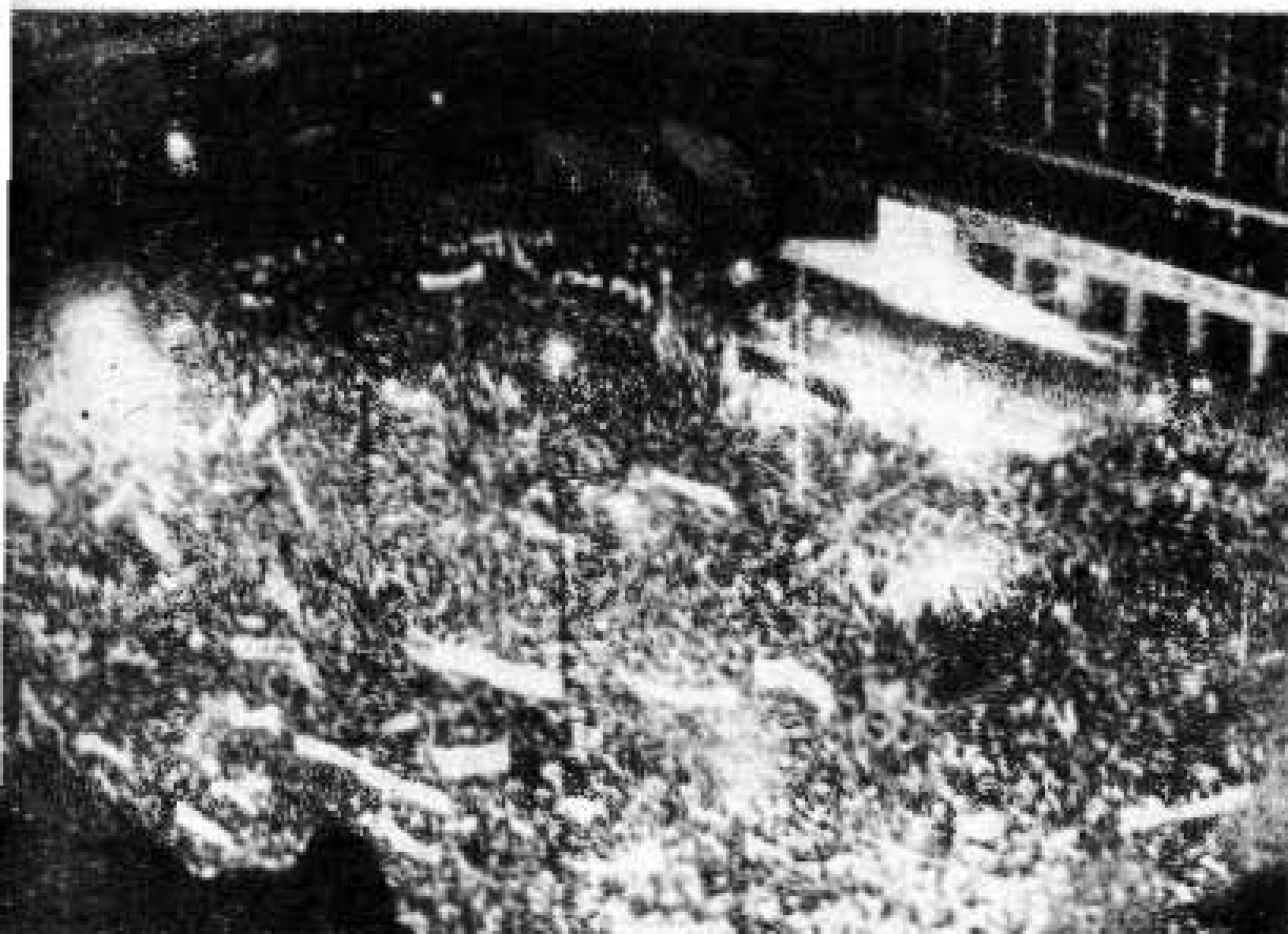
Seregni: estatura de líder y elemento aglutinador. Mitin del Frente Amplio en la campaña electoral de 1971.