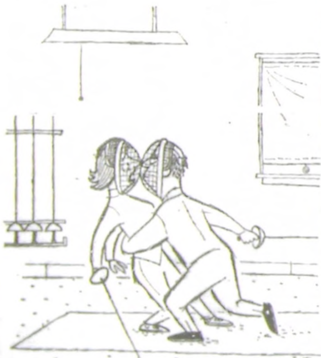
¡TOCADO, SR. PEREZ, TOCADO!...