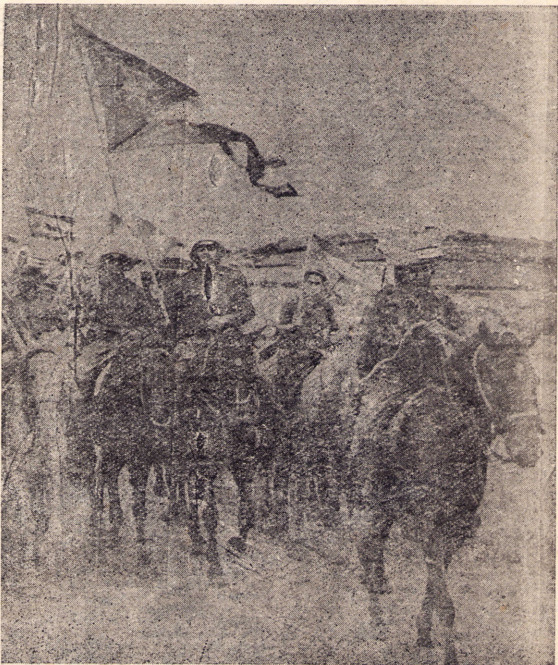
Camilo luchaba con alma entera de revolucionario, honesto a carta cabal.