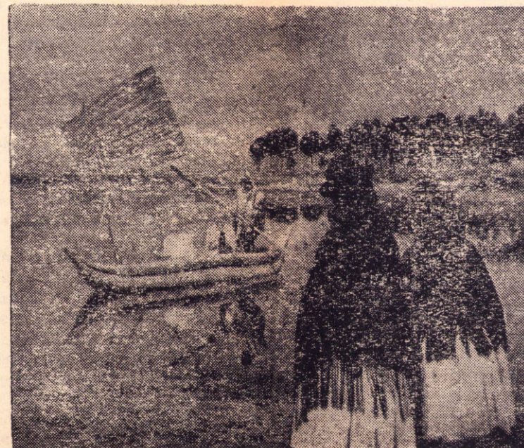
Una paz que contrasta con la realidad social

medias, rebajando los salarios de los obreros mineros, dejando cesantes a miles y miles de trabajadores, abatiendo una por una las sufridas conquistas de la revolución en cuyo seno él se desarrolló. Barrientos fue lanzado al primer plano de la vida política boliviana, desde filas del Ejército, en su carácter de cachorro predilecto del General del Pentágono, ahora retirado, Curtiss Le May. Abundantes medios le fueron proporcionados, a través de la ayuda directa del Pentágono a las fuerzas armadas bolivianas, al margen de la voluntad y el conocimiento del gobierno civil: de allí nace su prestigio entre los campesinos, obtenido gracias al reparto de ropas y alimentos que él realizaba por las zonas más remotas; los panes y los peces descendían del cielo en el avión de la Fuerza Aérea del General Barrientos. A los recursos materiales de que dispuso, se unía una indudable simpatía personal; así fue que el MNR se vio obligado a nombrarlo compañero de fórmula de Paz Estenssoro en las elecciones de 1964, y así fue que el Vice-presidente dio el golpe de estado, en estrecha colaboración con el Coronel Fox de la Embajada de los Estados Unidos, y conquistó el poder. Tuvo que compartirlo, sin embargo, con el General Ovando: las próximas elecciones le permitirán gobernar solo. Su compañero de fórmula, Luis