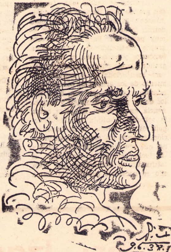
Vallejo, por Picasso

Y volvió a escribir con el dedo en el aire: "¡Viban los compañeros! Pedro Rojas". Su cadáver estaba lleno de mundo.