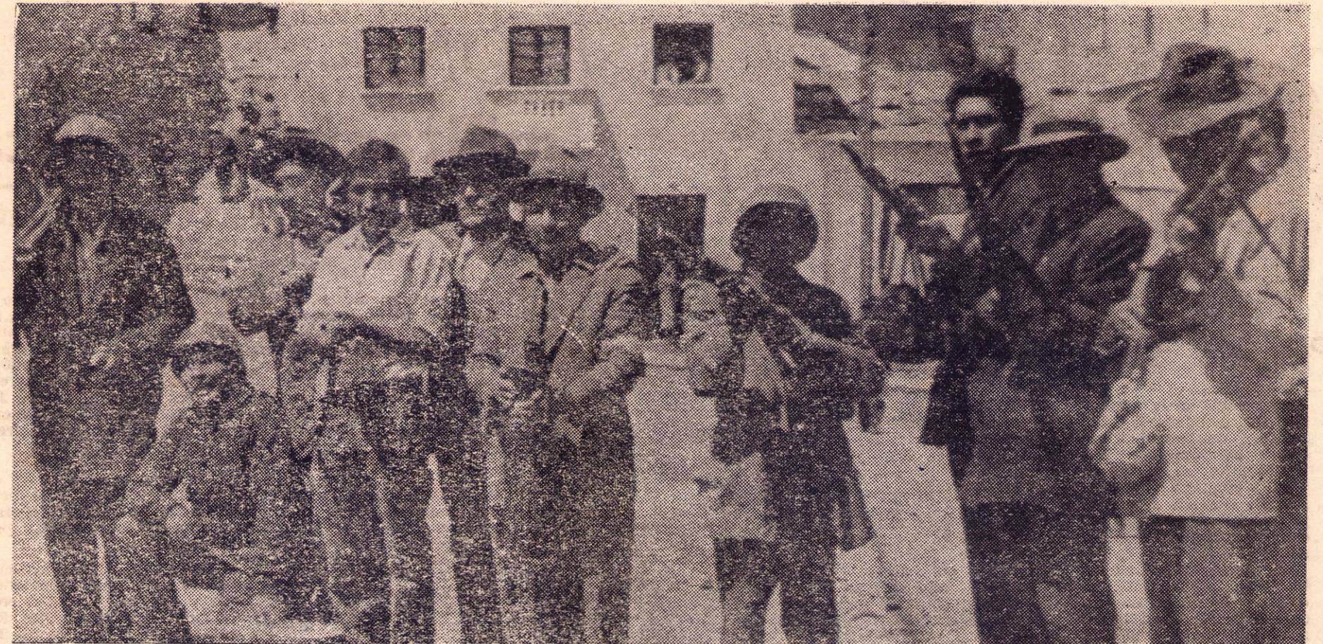
Pueblo armado, en la alborada revolucionaria de 1952.

El próximo 2 de julio, habrá elecciones generales en Bolivia. Ese día será elegido el Presidente que habrá de heredar el poder de la Junta Militar que derrocó, a fines del 64, al gobierno constitucional de Paz Estenssoro. También serán elegidos el vicepresidente y los legisladores de ambas Cámaras. Por medio de un procedimiento que asegura al Ejecutivo el control férreo de todos los órdenes de gobierno, el candidato que obtenga la mayoría de votos contará automáticamente con las cuatro quintas partes de los diputados.