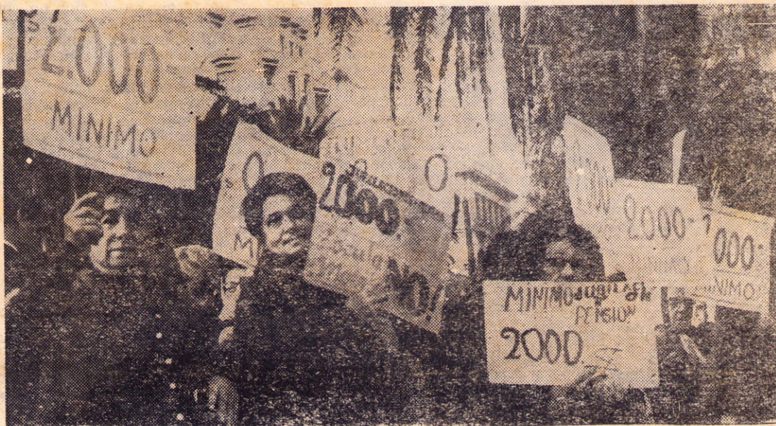
Reinician, los jubilados, las "Rondas del Silencio" (ver Editorial)

Sobre la marcha, la propia organización del Partido, en el cual la línea política es establecida por la discusión más amplia entre todos los militantes, en el cual la democracia auténtica no es una palabra y a la que en todo momento buscamos perfeccionar, es un ejemplo del régimen por el cual luchamos. Una acción permanente en cuyo camino nos esperan días difíciles, de lucha y sacrificio, pero en la que cada jornada será de perfeccionamiento y avance hacia el socialismo. El rumbo de la historia ya ha dictado sentencia contra el capitalismo y el imperialismo.