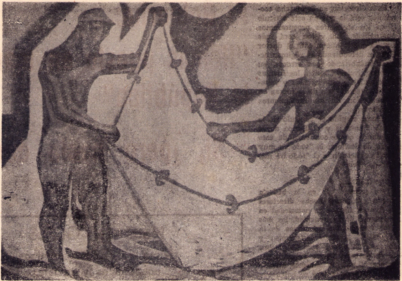
Los pescadores, por Luis Mazzei