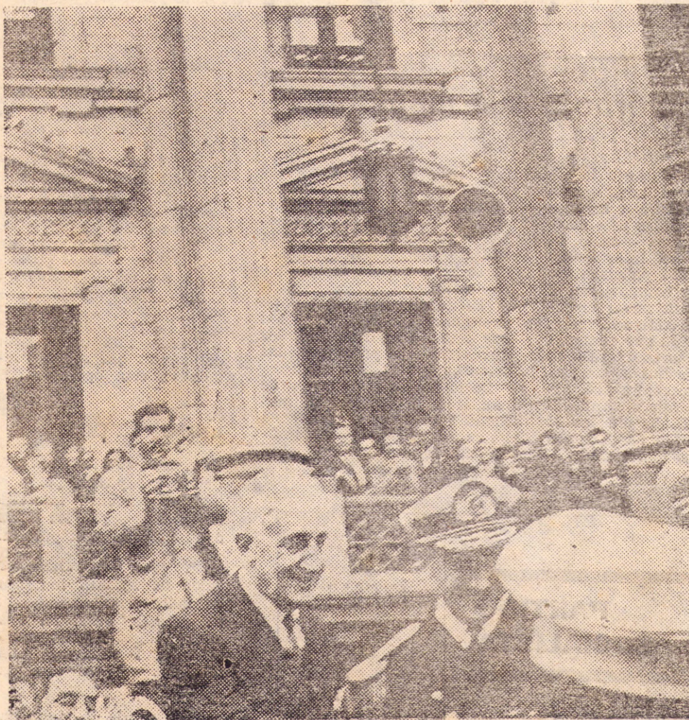
ILLIA, nacido de elecciones en las que la mayoría estaba proscripta, cayó sin propuesta popular.