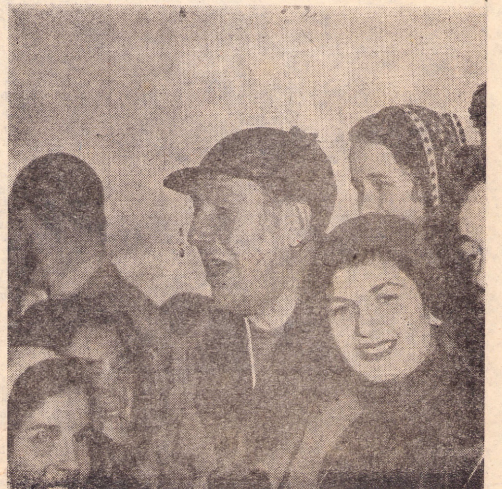
Ahora desde Madrid, la línea es en zig-zag

frente anticomunista" en el continente, con el fin de "garantizar" así "el combate sin tregua contra los focos de subversión que secesían formando en Venezuela, Chile, Paraguay y Uruguay", en nombre del "nuevo espíritu del principio de soberanía, basado en la existencia de un sistema político-social común y no en la existencia de unas fronteras físicas o políticas ya periclitadas". Onganía desmintió por entonces la existencia del pacto (que los diarios brasileños difundieron profusamente) aunque una posterior carta suya a un militar uruguayo confirmó la información, involuntariamente, en sus términos esenciales. Las libertades públicas de las que todavía goza el Uruguay, constituyen, de por sí, un mal ejemplo que es preciso suprimir, un desafío modesto pero incómodo a la prepotencia institucionalizada en el gobierno de los dos grandes vecinos. La penetración comunista podría muy bien ser no más que el grosero pretexto de siempre para promover y apoyar, incluso con la intervención directa, un golpe de estado en este pequeño país rioplatense. El Uruguay se encuentra ahora en el centro de los dos dientes de una sola tenaza: por un lado, Onganía, llamante dictador argentino; por el otro, Costa e Silva, virtual mandatario brasileño ya designado por el partido que inventó Castelo para santificar su continuidad en el poder. Tienen ahora, ambos, la oportunidad de llevar a la práctica su conjura de Cruzados del Imperio.