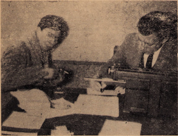
Alfredo Zitarrosa con nuestro cronista.