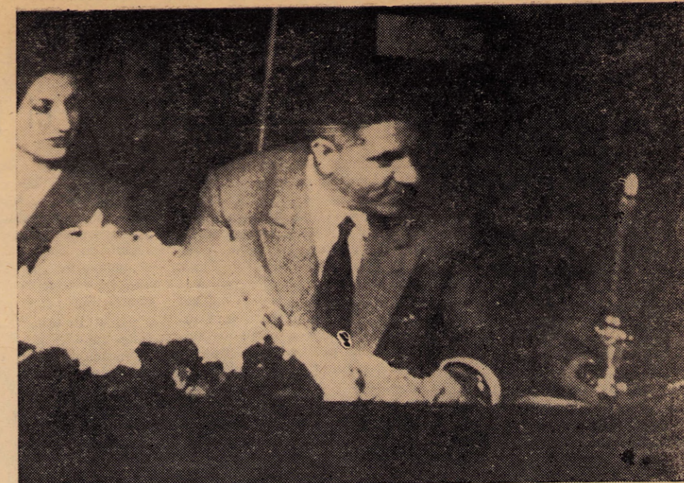
Nardone: ¿cabeza visible del "fascismo uruguayo"?

si aludió ligeramente a los graves problemas que afectan al empobrecido y cada vez más explotado modesto productor rural. En cambio formuló un planteo político simplista y claro.