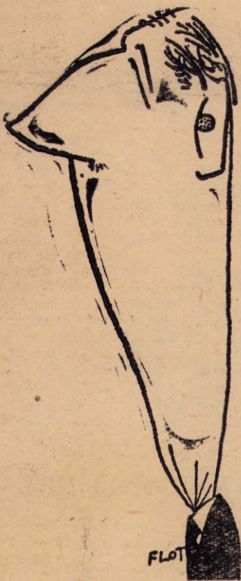
De Gaulle: Como en Auschwitz.

Más allá del estoicismo admirable de los argelinos, que deben reprimir sus impulsos de venganza para evitar una nueva guerra que frustraría su independencia, mueve a reflexión esta impunidad del crimen incesante, esta solidaridad de los colonos, esta apatía del ejército que quizá se resista a derramar sangre "francesa" sólo en salvaguarda de gente de segunda categoría, que tarde o temprano va a quedar como ama y señora de sus destinos. ¿Dónde ha quedado aquel