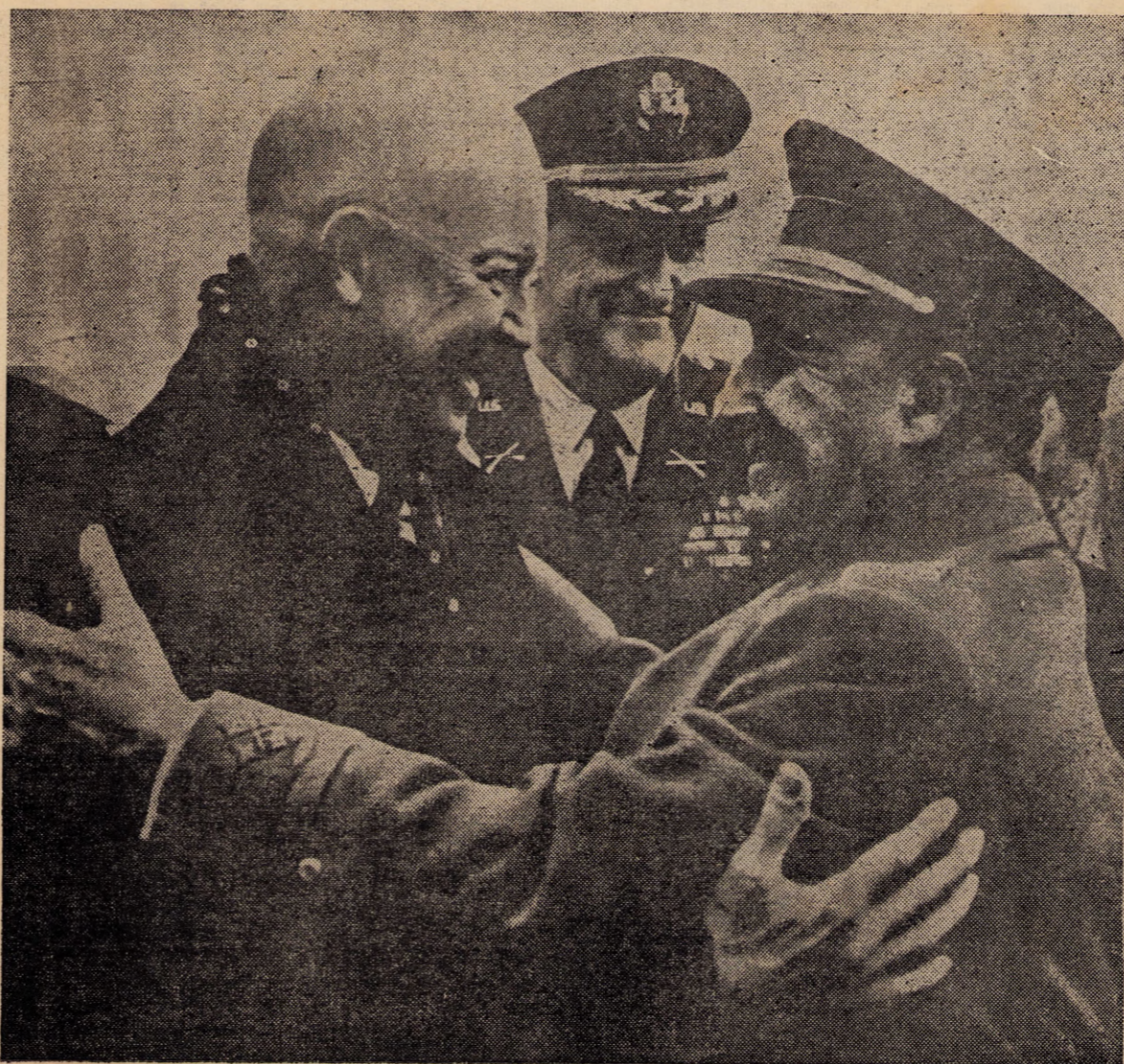
Eisenhower, que en esta fotografía saluda cordialmente a Franco, envió a Montevideo a su hermano Milion para concretar con los gobernantes de la época una de las tantas entregas de nuestra economía a los monopolios imperialistas norteamericanos. En esta nota se estudian algunos importantes aspectos de la acción del imperialismo en nuestro país.

Y así siguen años tras años estos países, que por algo alguien dice que son subdesarrollados, improvisando y errando. Dando palos de ciego; abrumados siempre por la solución perentoria, olvidando las soluciones de fondo; rememorar es más cómodo y más rápido que hacer. Así andamos siempre o mal vestidos o desnudos.