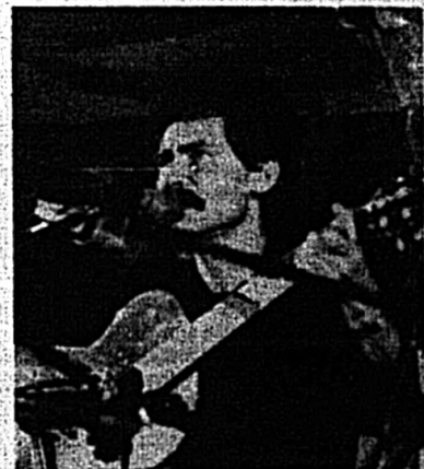
ta de belleza, de música, de texto.