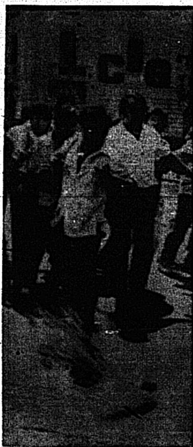
Una bomba lacrimógena hirió a Del Prado

Apenas scallados los comentarios derivados de la renuncia del ministro Rodríguez Pastor y del percalce del político que lidera la oposición, se produjo otra conmo-