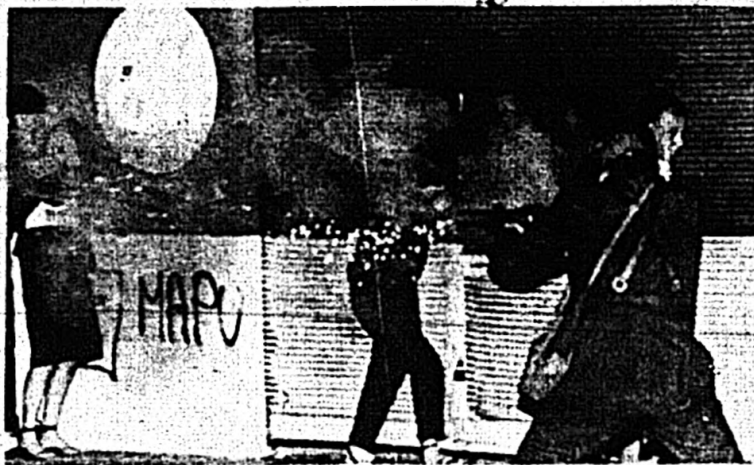
Los últimos tiempos han sido particularmente difíciles

Desde hacía tiempo insistentes rumores daban por renunciado a Jarpa, a raíz de un duro encuentro sostenido con Carlos Cáceres, en presencia de todo el alto mando de las fuerzas armadas, de la junta militar y de lo más representativo del poder Ejecutivo. En una reunión celebrada en el denominado huber de la Plaza de la Constitución, contiguo al palacio de La Moneda, el primero le había atribuido al equipo eco-