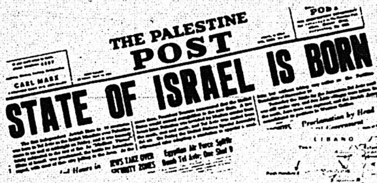
Edición del 16 de mayo de 1948 del periódico The Palestine Post anunciando el establecimiento del Estado de Israel.

En 1946, los ingleses rechazaron las recomendaciones del Comité Angloamericano, auspiciado por el presidente Truman, que proponía la admisión en Palestina de 100.000 judíos europeos, provenientes en su mayoría de los campos de "Personas desplazadas". La sección a cargo de la Haganá en el Movimiento de Resistencia Judía reaccionó volando todos los puentes que unían a Palestina con los estados vecinos. A lo largo del año 1947 la tensión continuó en aumento, y los actos de terror estaban sin fin. La respuesta del gobierno fue otra severa re-