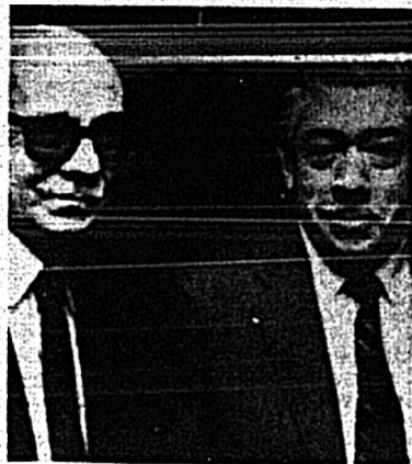
Sabato con Vargas Varreño, el hombre de los derechos humanos de la OEA.

Claro que esos 3.000 casos no son los únicos, porque la Comisión no empezó de cero. En su inicio recibió como denuncias las carpetas de Amnesty Internacional, CLAMOR, Asamblea Permanente de los Derechos Humanos, y el conocido Informe de la Comisión de Derechos Humanos de la OEA. Claro que los detractores de algunas de esas entidades cuestionan también la absoluta veracidad de sus informes, lo que puede seguir dando alre a la polémica. Por el momento la Comisión controla que las denuncias que recibe no estén en ninguno de esos informes sería el de 6.500 desaparecidos, aproximadamente. Eso llevaría el número total