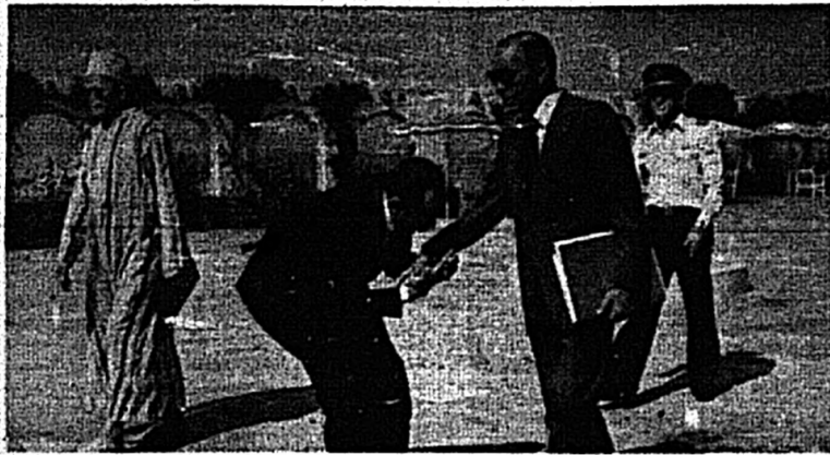
Rey Hassan de Marruecos.

Es uno de los pocos reyes que, a la vez, reinan y gobiernan. Hassan II de Marruecos está en el poder desde hace un cuarto de siglo. En diálogo con un periodista de Le Figaro Magazine explicó con nitidez el rompecabezas del Líbano, qué piensa de Khomeini y Khadafi y qué está pasando en el mundo islámico.