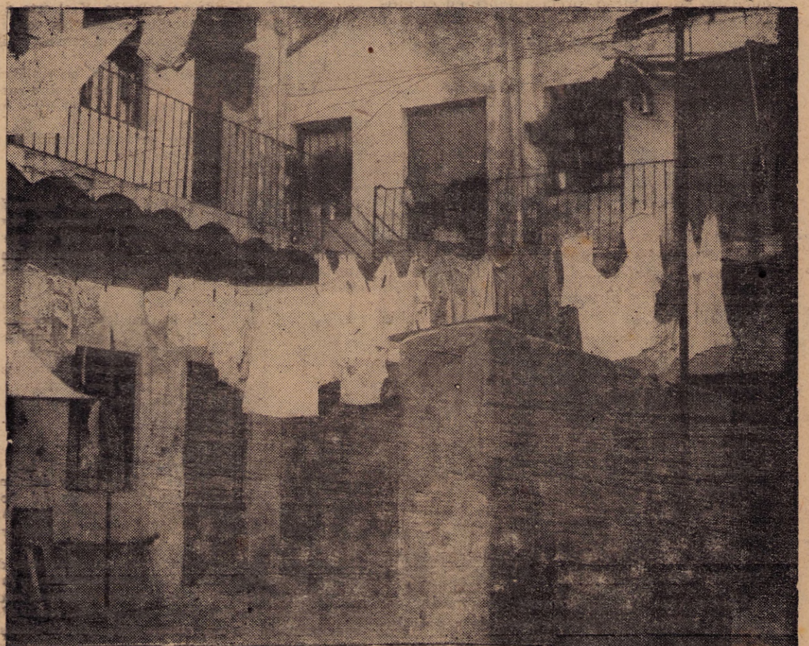
El ruinoso conventillo de la calle Gaboto, que debió clausurarse en junio de 1960 por razones de seguridad, continúa parcialmente habitado por culpa del Concejo Departamental y pese a los derrumbes que en él se han producido