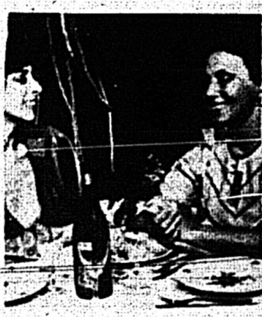
Comedias en Punta del Este: ¿por qué no?

no tiene el número de turistas que pueda tener Ibiza, Niza, Río de Janeiro o inclusive Mar del Plata. No tiene teatros como Mar del Plata, es ver-