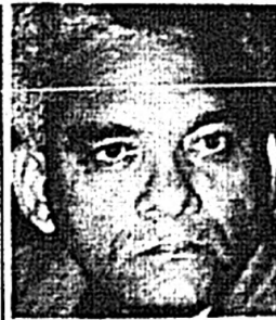
pagar los asalariados una deuda que no fue para beneficio de ellos”