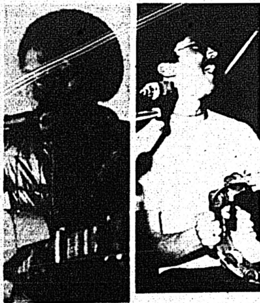
— De Prado —