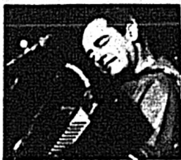
Carlos Mejía Godoy

De abuelos artesanos, creció rodeado de marimbas y guitarras —su padre tocaba el acordeón a piano— y un paisaje exuberante, invadido por percusiones negras, letanías indígenas y cantos de