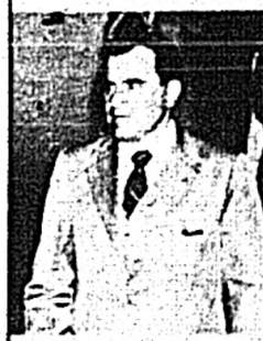
Dictador Juan María Bordaberry