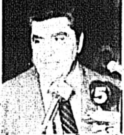
Ex-Ministro de Economía Contador Valentín Arismendi