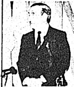
Dictador Gregorio Alvarez