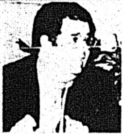
Ex-Presidente del Banco Central José Gil Díaz