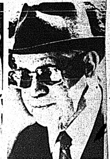
Dictador Aparicio Méndez