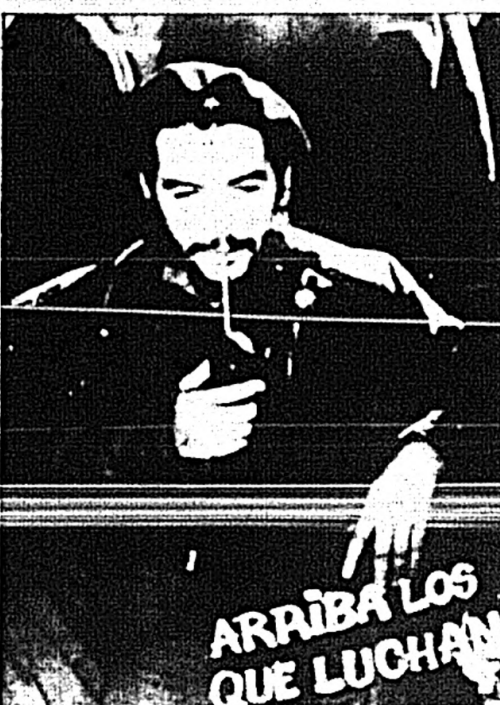
ARRIBA LOS QUE LUCHAN