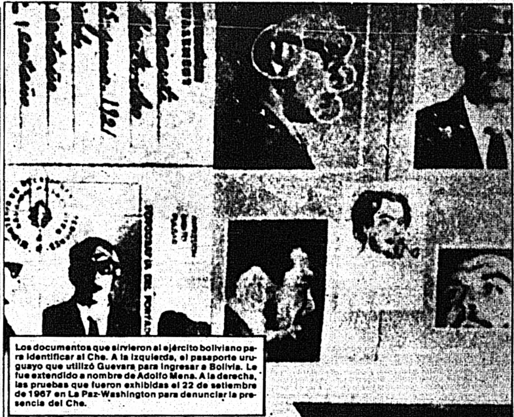
Los documentos que sirvieron al ejército boliviano para identificar al Che. A la izquierda, el pasaporte uruguayo que utilizó Guevara para ingresar a Bolivia. Le fue extendido a nombre de Adolfo Mena. A la derecha, las pruebas que fueron exhibidas el 22 de setiembre de 1967 en La Paz-Washington para denunciar la presencia del Che.