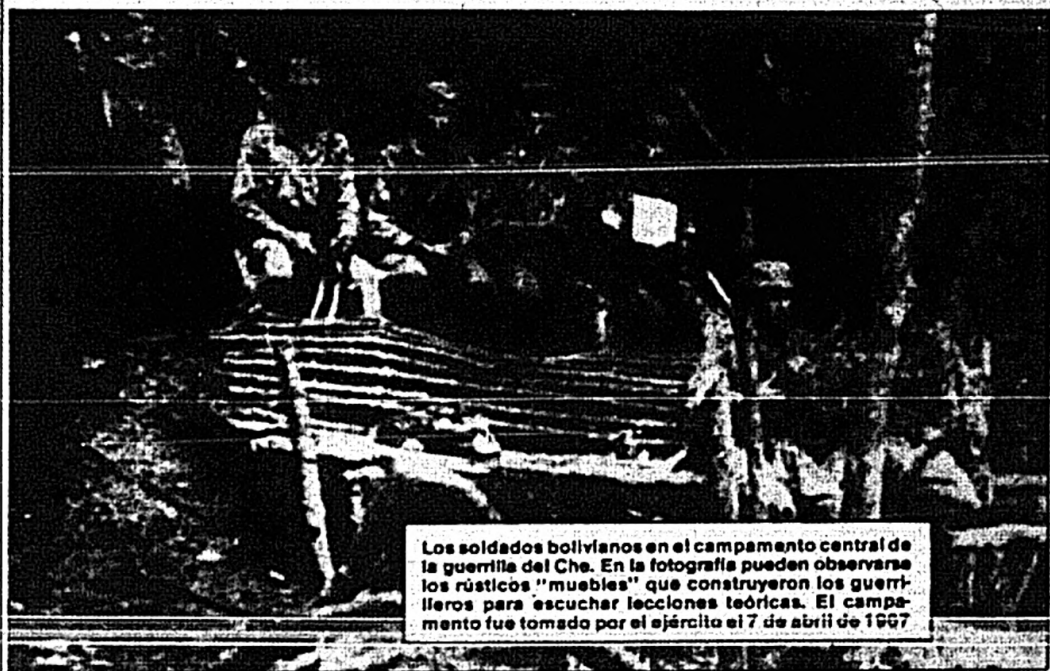
Los soldados bolivianos en el campamento central de la guerrilla del Che. En la fotografía pueden observarse los rústicos "muebles" que construyeron los guerrilleros para escuchar lecciones teóricas. El campamento fue tomado por el ejército el 7 de abril de 1967.

Se ha completado el equipo de cubanos con todo éxito; la moral de la gente buena y sólo hay pequeños problemitas. Los bolivianos están bien aunque sean pocos. La actitud de Monje puede retardar el desarrollo de un lado pero contribuir por otro a liberarme de compromisos políticos. Los próximos pasos, fuera de esperar más bolivianos, consisten en hablar con Guevara y con los argentinos Maucio y Jozami (Masseti y el partido disidente).