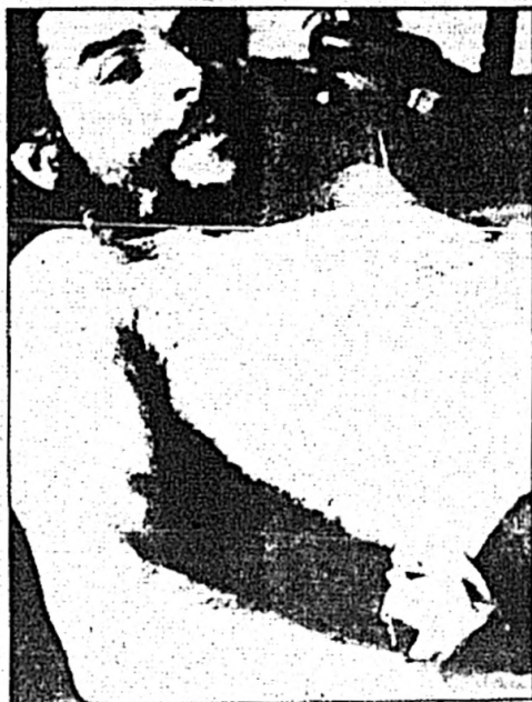
En las composiciones gráficas pueden apreciarse las heridas de bala en el cuerpo del Che. En la fotografía pueden observarse las heridas en el antebrazo derecho, en el costado derecho. La herida en el cuello sirvió para que por ella se formalizara el cadáver. Después la cosieron.

Nosotros vemos todavía como los jóvenes, héroes de hazañas casi, que pueden entregar su vida cien veces por la revolución, que se le llama para cualquier tarea concreta y esporádica, y marchan en