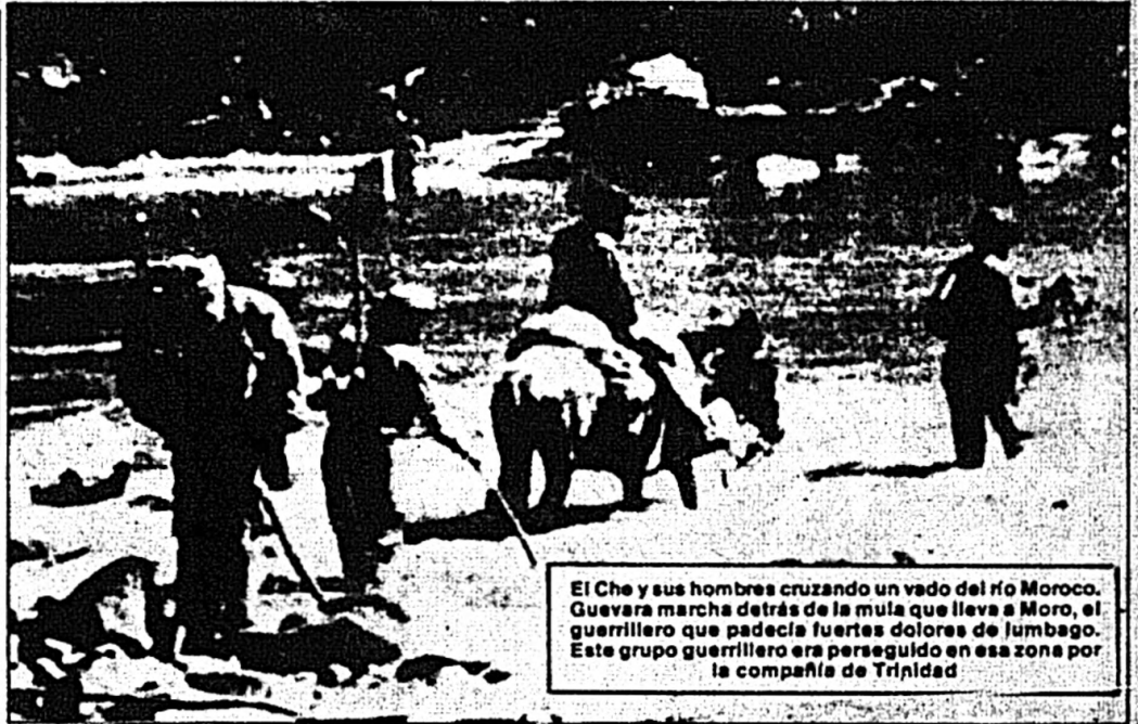
El Che y sus hombres cruzando un vado del río Moroco. Guevara marcha detrás de la mula que lleva a Moro, el guerrillero que padecía fuertes dolores de lumbago. Este grupo guerrillero era perseguido en esa zona por la compañía de Trinidad.

Día sin novedad alguna. Hicimos una breve exploración para preparar el terreno destinado a campamento cuando lleguen los 6 del segundo grupo. La zona elegida está a unos 100 metros del principio de la lumba, sobre un montículo y cerca hay una hondonada en la que se pueden hacer cuevas para guardar comida y otros objetos. A estas alturas debe estar llegando el primero de los tres grupos de a dos en que se divide la partida. A fines de la semana que empieza deben llegar a la finca. Mi pelo está creciendo, aunque muy ralo y las canas se vuelven rubias y comienzan a desaparecer; me nace la barba. Dentro de un par de meses volveré a ser yo.