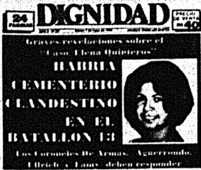
Fascimil de DIGNIDAD (N° 68) del 7/5/85

Por nuevas vías se siguen confirmando, una a una, las denuncias presentadas ante la opinión pública por DIGNIDAD. No bastan las declaraciones de parlamentarios oportunamente publicadas, sino que también entidades de primera línea en la defensa de los derechos humanos, como el Servicio de Paz y Justicia (SERPAJ), también confirman aquellas tremendas acusaciones que merecieron del Poder Ejecutivo el pase a la órbita del Ministerio Público para su investigación.