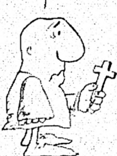
HE TRATADO DE TENER FE