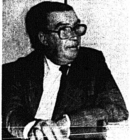
detestado algo el respecto?