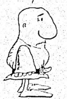
ME HE APRETADO AL MAXIMO EL CINTURON