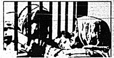
La semana pasada quedó instalada en Uruguay una organización que trabaja estrechamente con Amnistía Internacional que ha cumplido una función muy importante en cuanto a la defensa de derechos humanos en todos los continentes.