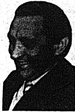
y constituido su central única

En el período 1937-1940 el movimiento obrero democrático estudiantil adquiere proporciones de gran importancia. La clase obrera había organizado su primer Congreso Nacional