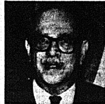
MINISTRO MANINI RÍOS DEBE RESPONDER ANTE LA DENUNCIA

encapuchado y agredido en Tranqueras por la Policía