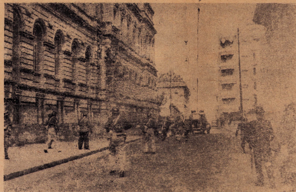
Las represiones policiales batllistas Segovia (15) era el Storage Arroza de entonces.

Esa etapa de interdependencia y vinculación trajo aparejado un proceso de indiferenciación política, al punto que las diferencias de fondo entre ambos partidos desaparecen." Esos intereses co-