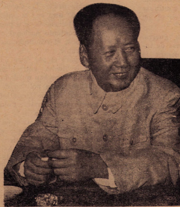
Mao Tse Tung

Rusia puede pactar la tregua con los yanquis y esperar que los años que corran traigan para occidente el agravamiento de sus contradicciones y para la URSS bienestar y mayor crecimiento. China siente que no puede esperar, que la revolución tiene que ser apun-tada en todos los terrenos, hoy.