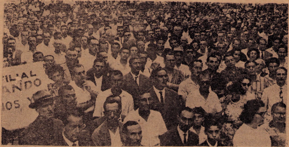
Vista parcial del mitin que realizaron los funcionarios de UTE.

ante la falta de hipocresía con que los trabajadores no quisieron revestir sus frases, y a la que ellos son tan afectos, resueltos enviar la nota al Fiscal de Crimen. Pre-delito, sostienen.