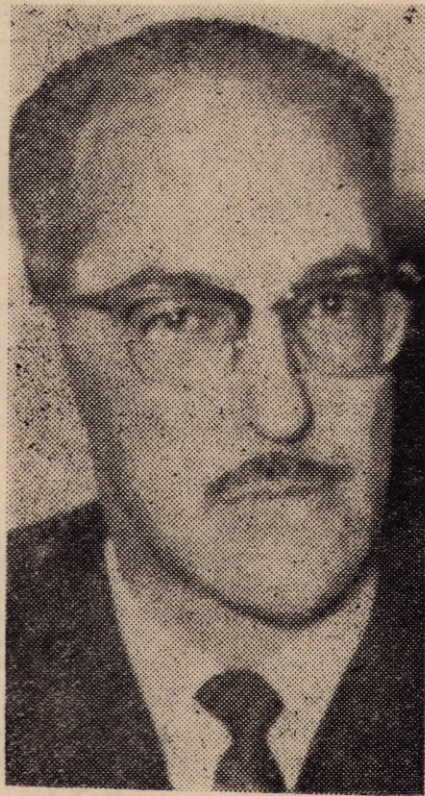
IBARRA: ENTRE EL DECRETO Y LA PARED

Ni aún los más optimistas pueden ver en la crisis política algo más que menudas pugnas de grupos: una lucha sin grandeza. No se discrepa en cuanto a medidas de fondo. Se pugna, ansiosamente, por algunos puestos claves. Ellos encierran posibilidad de ubicar correligionarios, resortes para lo pequeño. En lo profundo, un mismo interés clasista une a todo el nacionalismo. Hasta el momento actuó dividido. Puede resultar ahora unificado. Pero ¿para qué? ¿Es que acaso los ricos van a gobernar en beneficio de los pobres? ¿Qué historia registra esa contradicción? Mientras los blancos hoy, se entretienen en su juego político, el consumidor no se conforma con que "una pena se calme con el sufrimiento de otra", como el personaje shakespeariano.