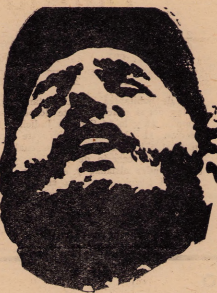
Fidel: la revolución en botas de siete leguas

sandri, Goulart y Kubitschek, hablaban sin mordorse la lengua de su "insuficiencia" y su "inadecuación" a la realidad de los países descapitalizados y subdesarrollados de la América morena. Mientras la Segunda Declaración de La Habana se paseaba con botas de siete leguas, desde las Antillas al Plata, las promesas