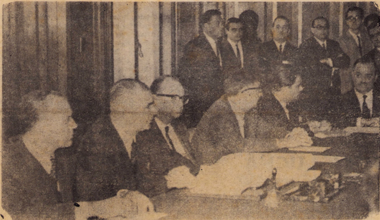
El equipo económico del gobierno, de acuerdo con la tradición, paga a los de afuera y le queda debiendo a los uruguayos.

BOLETO $ 5.00: EL PRIMER NARANJAZO DE SEGOVIA