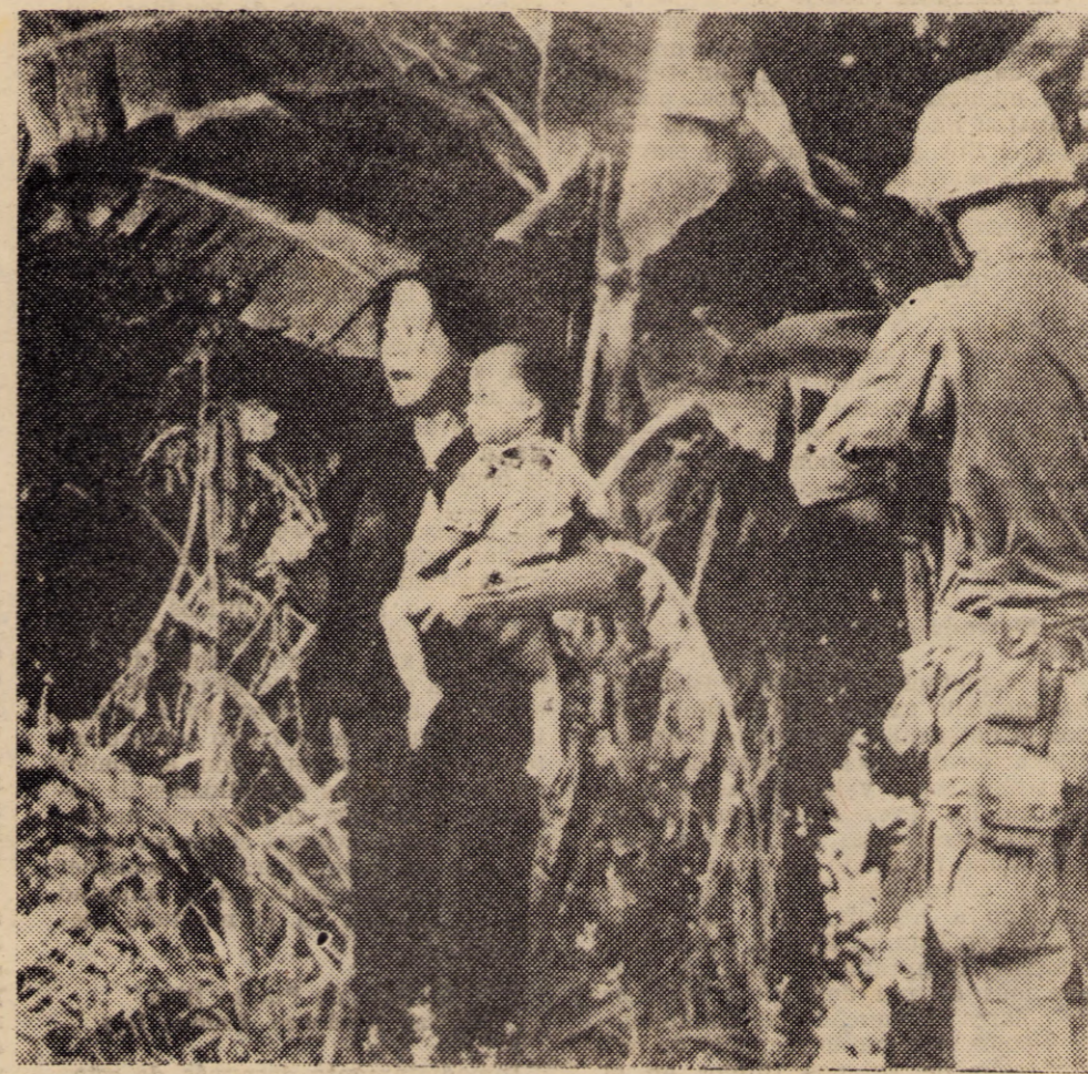
VIETNAM. Cientos de miles de muertos por el imperialismo y sus personeros. Johnson simboliza a los criminales que nacen del vientre monstruoso del Imperio Norteamericano. Pero la guerrilla no será derrotada. El heroísmo infinito del pueblo vietnamita y la solidaridad militante de todos los pueblos del mundo, terminará con tanta ignominia.

En América Latina como en el resto del mundo, asistimos a la proyección de la política estratégica mundial del imperialismo yanqui; en el sudeste de Asia, especialmente en Vietnam, los imperialistas yanquis mientras se habla de paz, practican la intensificación de la guerra de ex-