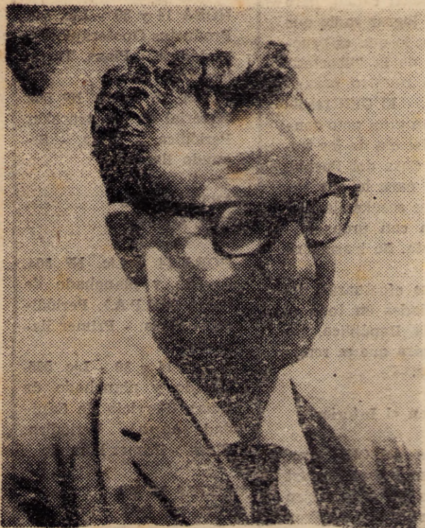
ALLENDE: Por los pueblos.