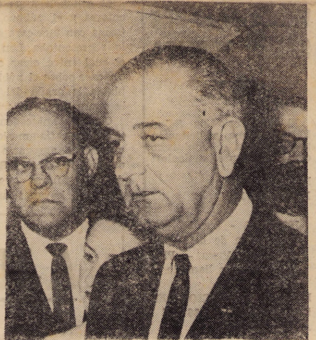
JOHNSON: Contra los pueblos.