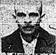
Almirante del Penal