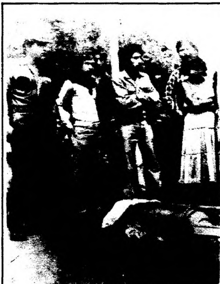
Cuerpo de un estudiante guatemalteco muerto en un ataque a la Universidad de San Carlos el 4 de julio de 1980. Las autoridades habían denunciado a la universidad como un "centro subversivo" y funcionarios y estudiantes habían sido asesinados. Entre marzo y setiembre de 1980 por lo menos 27 funcionarios fueron muertos. Las muertes continuaron en 1981 y 1982: el decano de la Facultad de Derecho y seis profesores, por ejemplo, fueron asesinados entre el 27 de febrero y el 7 de mayo de 1981.

La ciudad fue rodeada por tropas sirias y posteriormente bombardeada desde tierra y