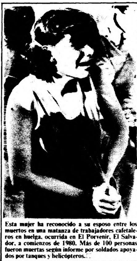
Esta mujer ha reconocido a su esposo entre los muertos en una matanza de trabajadores cafetaleros en huelga, ocurrida en El Porvenir, El Salvador, a comienzos de 1980. Más de 100 personas fueron muertas según informe por soldados apoyados por tanques y helicópteros.

Estos homicidios políticos son crímenes por los cuales los gobiernos y sus agentes son responsables según el derecho nacional e internacional. El hecho de que haya en sus territorios grupos de oposición que estén cometiendo actos similarmente aborrecibles no reduce en nada su responsabilidad. Tampoco la obligación del gobierno de investigar los homicidios ilegales y tomar medidas para evitarlos el hecho de que resulte difícil probar quiénes son —en última instancia— los responsables de dichas muertes.