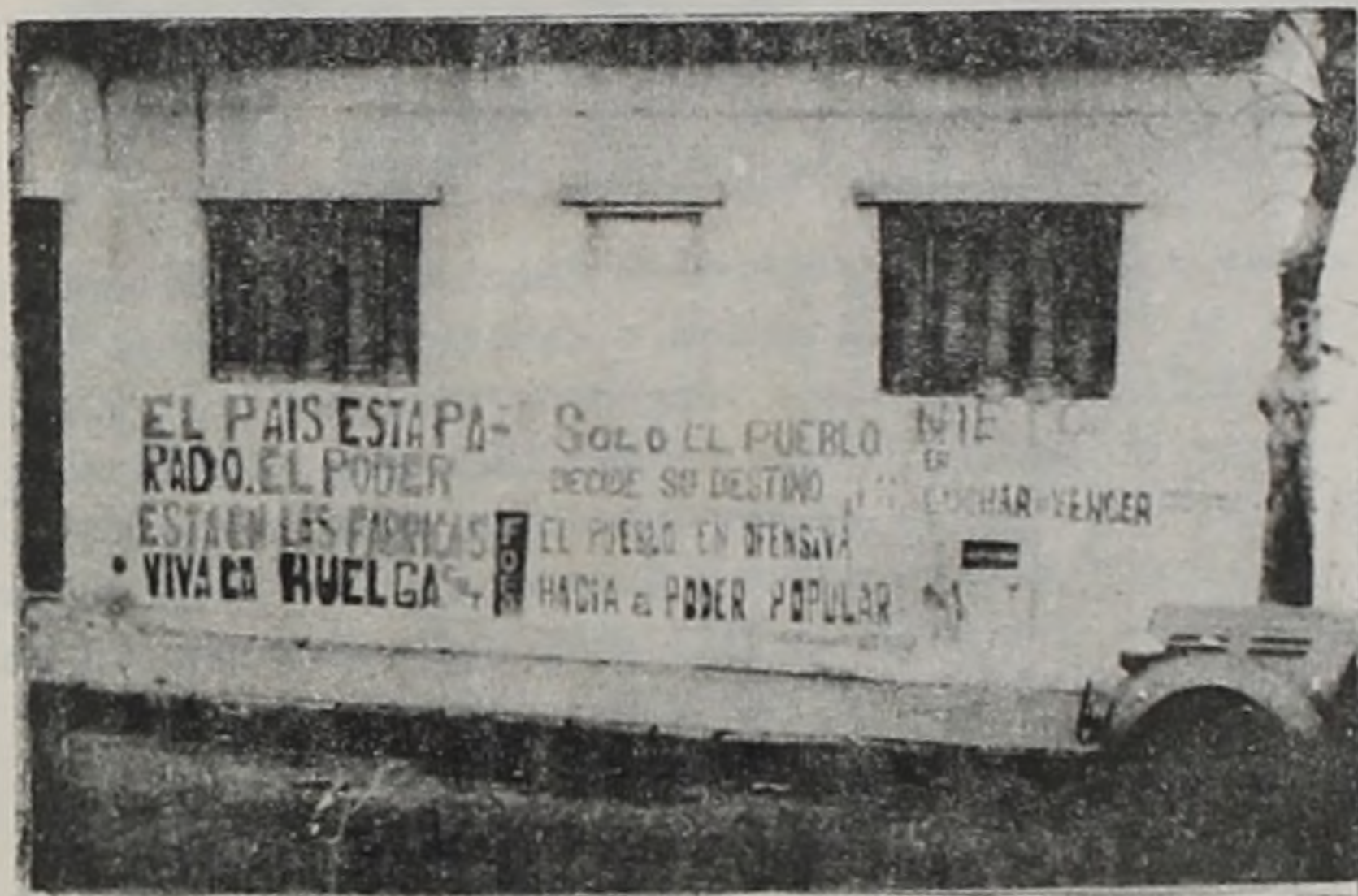
La huelga general: los obreros y el pueblo resisten el golpe.

-Que lo que se proponen no es modernizar ese cuerpo de leyes para ponerlo al día con la ciencia del derecho penal y limpiarlo de aquellos preceptos inspirados en la legislación de Mussolini.