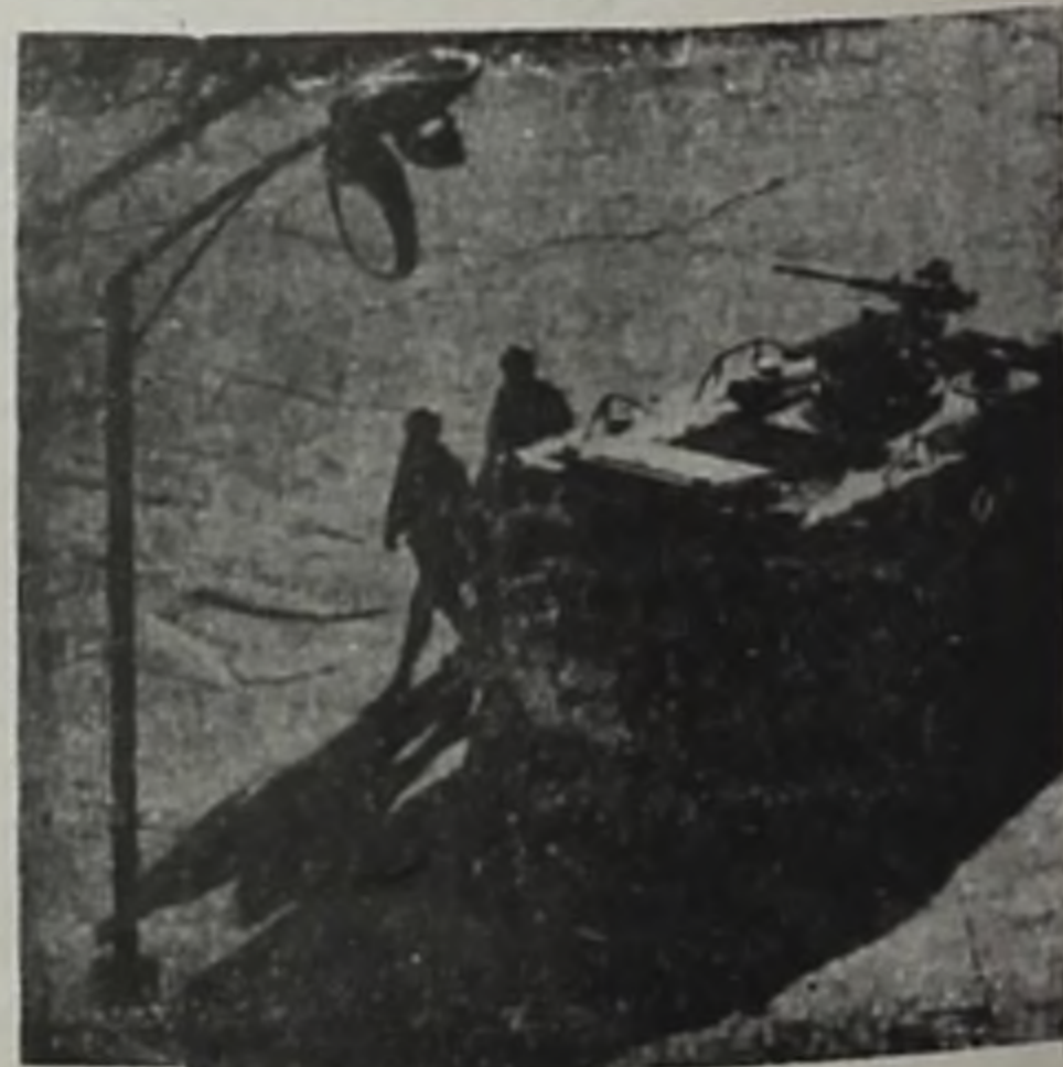
El fascismo: La violencia de la clase explotadora

La economía uruguaya está en retroceso y en crisis. Para que su aparato productivo salga de la situación actual y se desarrolle, es necesario que aumente el consumo, que haya mayor demanda. La demanda no puede aumentar si los salarios reales continúan bajando brutalmente, como ocurrió el año pasado (que disminuyeron en un 16%) y como sigue ocurrien-