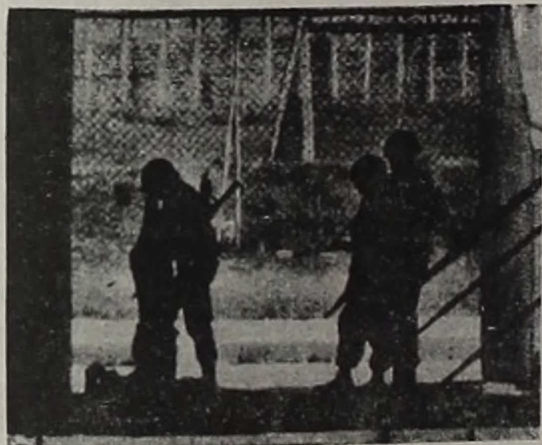
La represión fascista contra el pueblo.

Chile es hoy un país sometido por sus FF.AA. a un régimen similar al de un país ocupado por fuerzas extranjeras. El país bajo "Estado de Sitio", todas las ciudades bajo "Toque de Queda", tribunales militares sin apelación, bajo el Código Militar "en tiempo de guerra", encarcelamiento masivo de la población, tortura generalizada, fusilamientos sumarios, verdade-