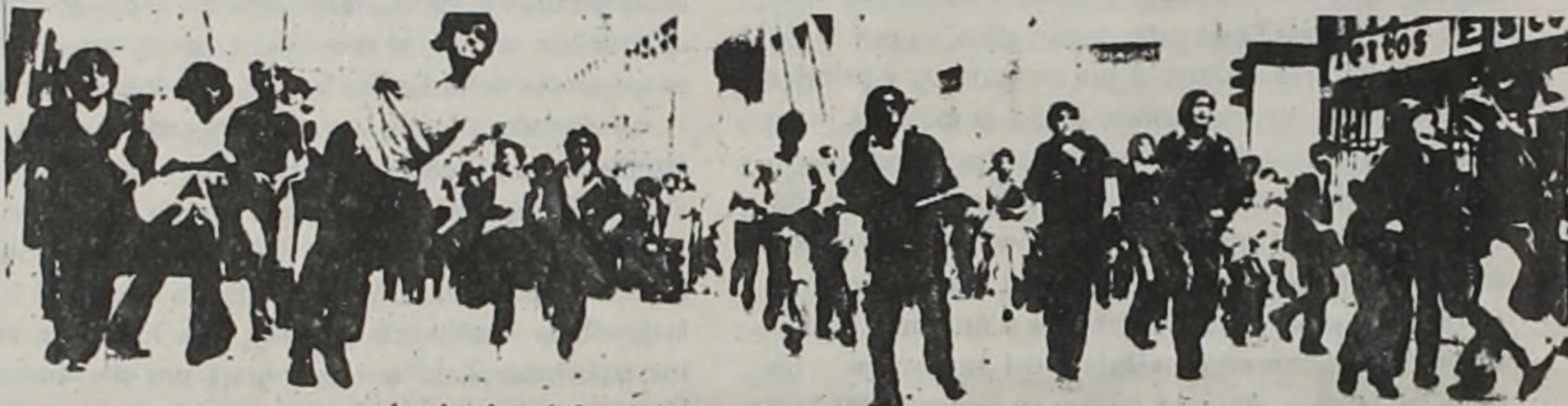
La lucha del pueblo unido derrotará al fascismo

Sólo en general: Unir a toda la izquierda y a todo sector democrático dispuesto a impulsar la lucha contra la dictadura, reorganizar el movimiento de masas en nuevas formas y desarrollar la resistencia popular a la dictadura en todas las formas, a lo largo y ancho del país.