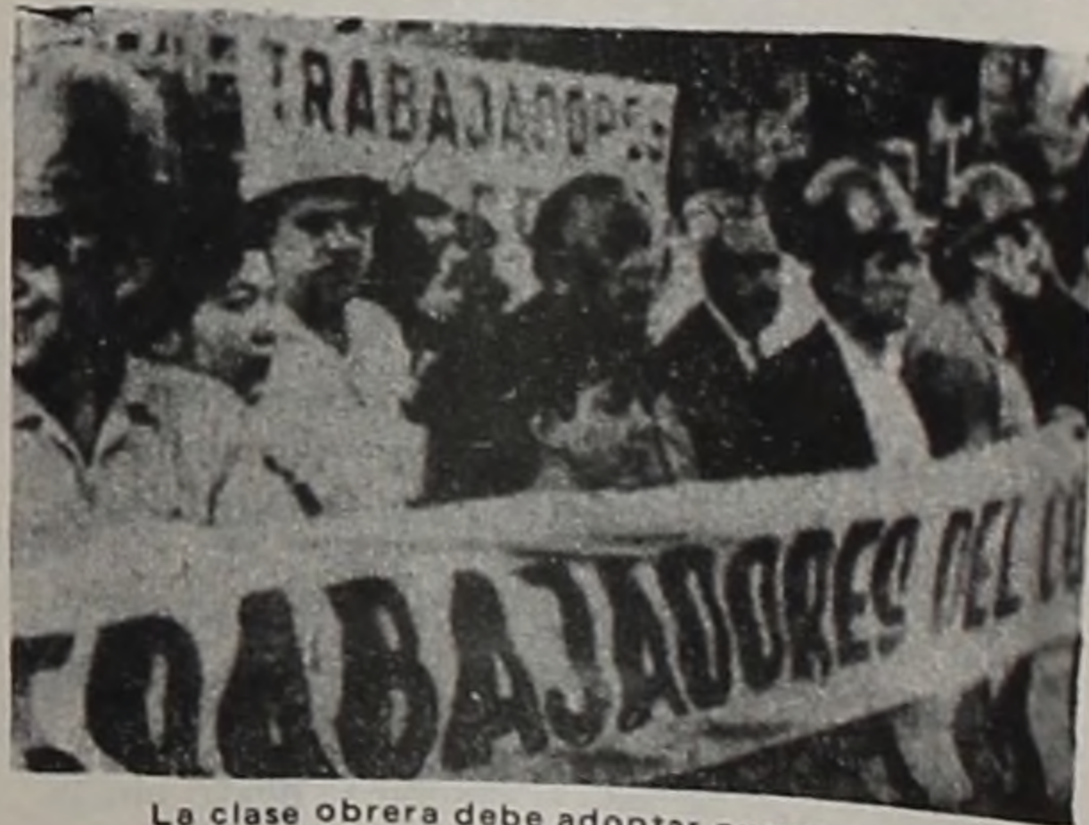
La clase obrera debe adoptar nuevas formas de lucha.

Un mes antes del Golpe de Estado denunciarnos por