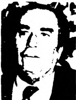
WILSON FERREIRA ALDUNATE

En declaraciones formuladas el 9 de mayo en La Paz, Bolivia, a la agencia DPA, el líder del Partido Nacional Wilson Ferreira Aldunate señaló que "el pueblo uruguayo desea vivir en un estado de derecho y gozando de las libertades que hasta hace 10 años fueron su praxis cotidiana, y es en ese marco que se desarrolla el actual proceso de democratización".