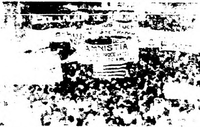
EL RECLAMO DE AMNISTIA EN EL CORAZON DE LA CONCENTRACION OBRERA. CARTELES DE LOS BANCARIOS, DE ESTUDIANTES, DE LOS GREMIOS DE LA BEBIDA, Y EL RECLAMO DE AMNISTIA DE LAS MADRES DE LOS PROCESADOS POR LA JUSTICIA MILITAR.

el camino que conduce a la restauración de una democracia plena, y a la vez, el papel de primer plano de la clase obrera en la reconquista de las libertades colectivas.