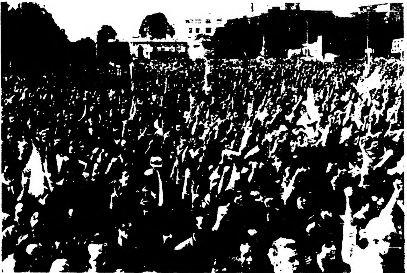
PUNOS EN ALTO DE LA COMBATIVA DEMOSTRACION OBRERA.