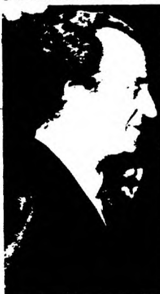
JUAN CARLOS I

Del 20 al 22 de mayo visitaron Uruguay el rey de España, Juan Carlos I, y la reina Sofía, en el curso de una gira latinoamericana. Por encima de la programación oficial y protocolar, lo más importante fue la presencia del pueblo uruguayo en los múltiples actos, en los que unió su cálido saludo al rey, por su conocida trayectoria democrática, con el reclamo de libertad y amnistía para Uruguay.