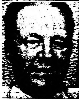
MONSEÑOR CARLOS PARTELI

La CEU expresa que "la realidad social nos muestra a tantos hermanos carentes de medios necesarios para una vida digna, llegando incluso hasta el extremo de la indigencia y del hambre; hermanos sin vivienda decorosa; hermanos desocupados y sin trabajo en perspectiva; niños desamparados; ancianos desatendidos en sus mínimas necesidades, familias enteras sin un horizonte de solución para sus crisis y problemas". Recuerda que en análogo documento del año pasado hacía referencia a los temas críticos del desempleo, y los bajos salarios, jubilaciones y pensiones, y añade que estos problemas se han "agravado por un sistema económico-social de índole también internacional que agrede con su egoísmo, indiferencia y frialdad al hombre concreto".