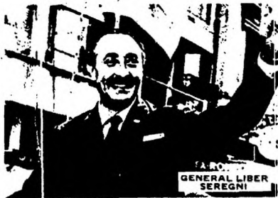
GENERAL LIBER SEREGNI