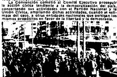
MANIFESTACION BATLLISTA POR 18 DE JULIO.

La Convención cometió al Comité Ejecutivo proseguir la acción cívica tendiente a la democratización del país, concertando sus actividades con el Partido Nacional y la Unión Cívica, ampliando dichas actividades, cuando se estimase del caso, a otras entidades nacionales que persigan los mismos propósitos en favor de la libertad y la democracia.