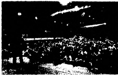
ALFREDO ZITARROSA, EN EL ESTADIO DE OBRAS REPLETO, SALUDA A SUS COMPATRIOTAS.