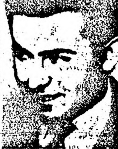
LIBER ARCE, MARTIR DICA de la Unión de la Juventud OBRERO-ESTUDIANTIL, fue Comunistas lleva su nom-

En la tarde del lunes 13 de agosto, mil estudiantes rindieron homenaje a la memoria de Liber Arce en la explanada de la céntrica Universidad de la República en una nueva recordación del "Día de los Mártires Estudiantiles" organizada por la Federación de Estudiantes Universitarios del Uruguay (FEUU).