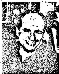
JULIO MARIA SANGUINETTI

Los decretos del 2 de agosto fueron recibidos con un estallido de indignación colectiva que fue reflejada en las declaraciones de los dirigentes políticos de los partidos.