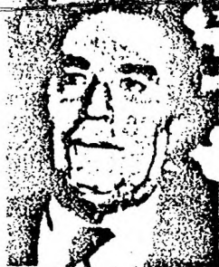
WILSON FERREIRA ALDUNATE