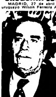
WILSON FERREIRA ALDUNATE