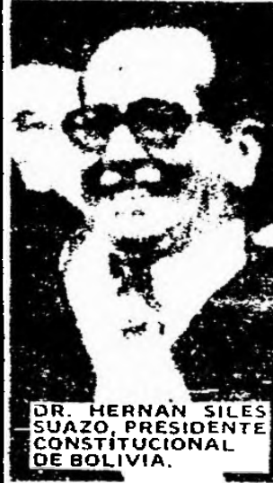
DR. HERNAN SILES SUAZO, PRESIDENTE CONSTITUCIONAL DE BOLIVIA.

Figuras representativas de las fuerzas antidictatoriales uruguayas estuvieron presentes, especialmente invitadas por el gobierno, los partidos y la COB, en el gran acontecimiento latinoamericano que significó la asunción a la presidencia de Bolivia por parte del Dr. Hernán Siles Suazo, el 10 de octubre. Este hecho, que culmina una brega tenaz de todas las fuerzas obreras y democráticas de Bolivia por la recuperación de la democracia, se proyecta con efectos positivos en todo el Cono Sur latinoamericano, donde se han entronizado dictaduras fascistas.