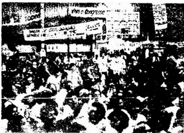
VISTA DEL 34º CONGRESO DE LOS ESTUDIANTES BRASILENOS.