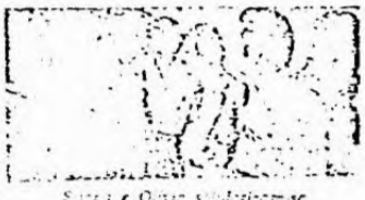
Missão viajou ao Uruguai

Un grupo de sindicalistas uruguayos se reunió en Montevideo para exponer el difícil cuadro de la realidad sindical uruguaya. Los funcionarios uruguayos se mostraron interesados en conocer la realidad sindical brasileña.