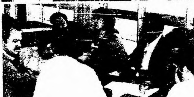
ASPECTOS DE LA CONFERENCIA DE PRENSA EL 20 DE SEPTIEMBRE EN LA ASAMBLEA LEGISLATIVA DE SAN PABLO. EL REPORTEADO ES EL PRESIDENTE DEL SINDICATO DEL METRO DE SAN PABLO, ATRAS, METALURGICOS DE SAN BERNARDO Y SOCIOLOGOS.