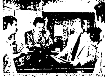
Uma comissão representando dezesseis sindicatos brasileiros...