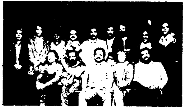
LOS DELEGADOS SINDICALES BRASILEÑOS CAPTADOS EN LA SEDE DE AEBU.

La delegación brasileña, que se declaró sorprendida por el clima de madurez y conciencia evidenciado por las organizaciones gremiales uruguayas, solicitó autorización para visitar a los numerosos dirigentes sindicales que se encuentran en prisión desde hace largos años, lo que fue rechazado.