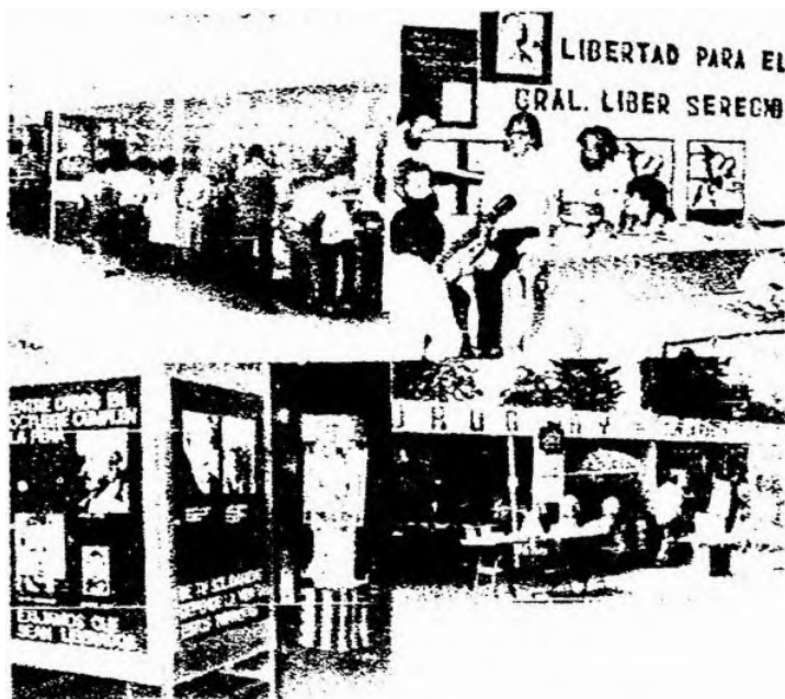
STAND DE URUGUAY EN LA FIESTA ANUAL DE "TREBALL", EN BARCELONA