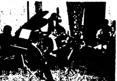
CAMERATA PUNTA DEL ESTE: INTERPRETACION MAGISTRAL DE TANGOS URUGUAYOS PARA CULMINAR UNA JORNADA DE UNIDAD Y LUCHA ANTIDICTATORIAL.

Señaló el líder dominicano que la Convergencia Democrática uruguaya merece el reconocimiento de toda América Latina y que, por la amplitud con que en su seno se ha conforzado la unidad, puede ser un ejemplo a seguir por otros países bajo dictadura en el continente. Como conclusión expresó su certidumbre de que, al igual que en Nicaragua, en Uruguay la unidad será la clave de la victoria.