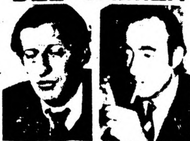
Zelmar Michelini Héctor Gutiérrez Ruiz

LOS EX-LEGISLADORES URUGUAYOS HECTOR GUTIERREZ RUIZ, PRESIDENTE DE LA CÁMARA DE DIPUTADOS, Y SENADOR ZELMAR MICHELINI, ASSESINADOS EL 20 DE MAYO DE 1974 EN BUENOS AIRES SE LES HA DENOMINADO LOS "HEROES SIMBÓLICOS" DE LA CONVERGENCIA DEMOCRÁTICA.