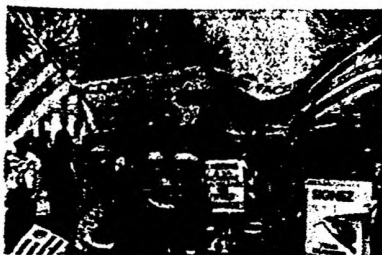
LA CNT EL 1o. DE MAYO EN PARÍS

Trabajadores y exiliados uruguayos manifestaron el pasado 1o. de Mayo en París, bajo las banderas de la CNT, en las columnas organizadas por las centrales obreras CGT (en la foto) y C.F.O.T. Las consignas centrales de la CNT fueron: amnistía para Uruguay, libertad para todos los presos sindicales y políticos, fuera el imperialismo de América Latina, solidaridad con El Salvador. Se recogieron firmas por la amnistía en Uruguay y se distribuyeron por miles, los manifiestos de la CNT en Francia en adhesión a la fecha obrera internacional.