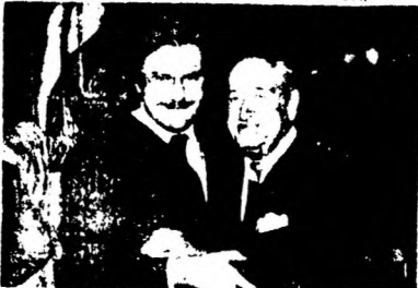
ABRAZO FRATERO ENTRE JUAN RAÚL FERREIRA Y EL EX-PRESIDENTE DE LA REPÚBLICA ARGENTINA, DR. HECTOR J. CAMPORA.