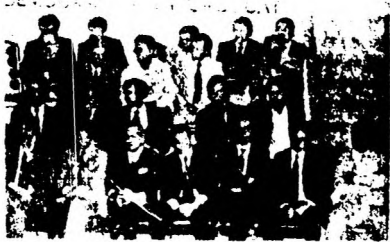
UN ESTRADO QUE ES SIMBOLO DE UNIDAD DEMOCRÁTICA Y SOLIDARIDAD LATINOAMERICANA. FICIAS MEXICANAS Y DE AMERICA LATINA JUNTO A LOS INTEGRANTES DEL GRUPO DE LA CONVERGENCIA DEMOCRÁTICA EN URUGUAY.