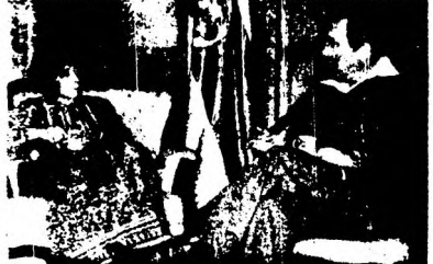
EL PRESIDENTE DE COSTA RICA, RODRIGO CARAZO, RECIBE A BETHEL SEREGNI.