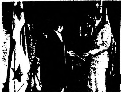
EL PRESIDENTE PANAMEÑO DR. ARISTIDES ROYO ENTREGA A LA HIJA DEL GENERAL LIBER SEREGNI, LA MAXIMA CONDECORACION DE SU PAIS.