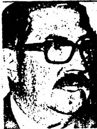
GENERAL BALLESTRINO: NEGOCIOS TURBIOS CON DINEROS PUBLICOS.