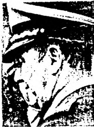
GENERAL VADORA: JUGOSOS NEGOCIADOS CON PARIENTES DE STROESSNER