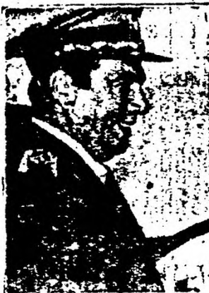
GENERAL QUEIROLO: RECIBIO UN APARTAMENTO DE REGALO