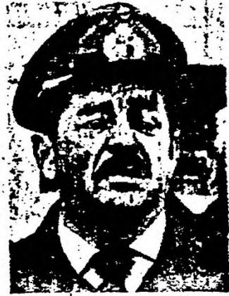
GENERAL NÚÑEZ: RESULTO SER EL FE DEL "DESAPARECIDO" SOCA

BAJO EL TITULO "A OCHO AÑOS DEL GOLPE EN URUGUAY, SE HA AGUDIZADO LA CORRUPCION ENTRE LOS MILITARES", HA SIDO PUBLICADO EL SIGUIENTE DESPACHO DE LA AGENCIA NOTICIOSA IPS, FECHADO EN MONTEVIDEO EN LA VISPERA DEL ANIVERSARIO DEL GOLPE FASCISTA EN URUGUAY