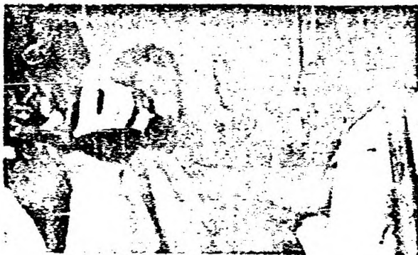
UNA DELEGACION DEL MOVIMIENTO MEXICANO POR LA PAZ Y PERIODISTAS, INSISTE ANTE LA EMBAJADA URUGUAYA EN MEXICO PARA ENTREGAR UN PETITIVO POR LA LIBERTAD DEL GENERAL LIBER SEREGNI.

El embajador Rovira, que ha sido duramente criticado por la prensa mexicana en su carácter de prisionero de la dictadura, ha revelado en varias ocasiones su carácter irascible. Se supo, por ejemplo, que exteriorizó su furia ante la colocación de una pancarta del Sindicato de Telefonistas, en el monumento a Artigas, el día del 80. aniversario del golpe de Estado, en reclamo de que se cumpla la voluntad popular en Uruguay.