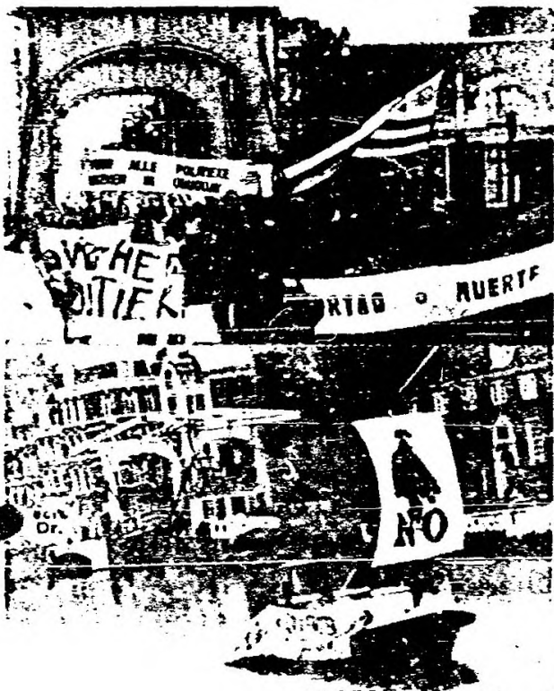
LA MANIFESTACION CRUZA UNO DE LOS PUENTES DE AMSTERDAM CON LA BANDERA URUGUAYA Y EL LEMA "LIBERTAD O MUERTE" AL FRENTE

UNA EMBARCACION LLEVA POR LOS CANALES DEL CENTRO DE AMSTERDAM (LA PARTE VIEJA Y MAS BONITA DE LA CIUDAD) UN CARTEL QUE EXALTA LA VICTORIA DEL NO EN EL PLEBISCITO Y CONSIGNAS POR LA LIBERTAD DE LOS PRESOS POLITICOS URUGUAYOS