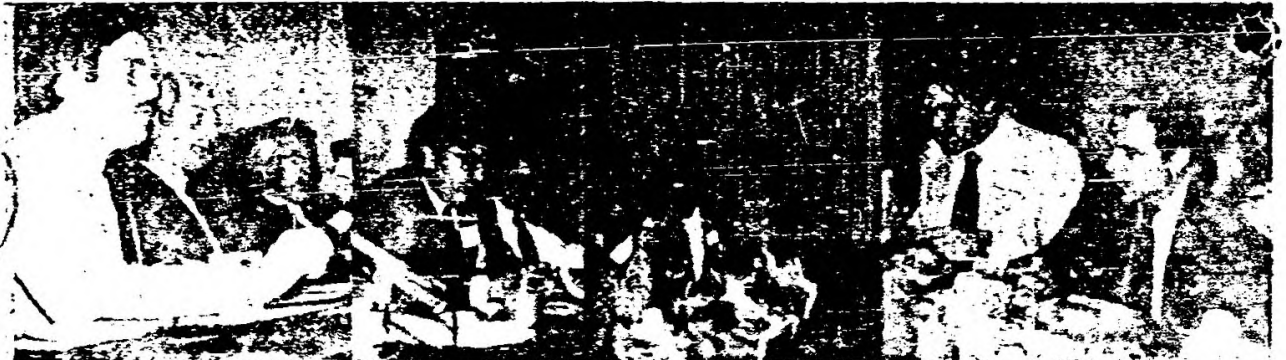
El 12 de junio se efectuó en Washington un simposio titulado "Uruguay luego del plebiscito: perspectivas para la democracia", organizado por la Facultad de Derecho de la Universidad Americana y la Washington Office on Latin