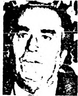
WILSON FERREIRA ALDUNATE

El 21 de julio la agencia AP difundió desde Nueva York una entrevista con Wilson Ferreira Aldunate, quien se encontraba en Barcelona. El líder del Partido Nacional señala que "la transición hacia la democracia en Uruguay es inevitable por la presión ciudadana". Agregó: "Creo que la experiencia se agotó; el régimen no da más... El Uruguay vive momentos de una muy intensa politización, lo cual contribuye a la irreversibilidad del proceso. Lo que no se sabe es si esto (las consultas con los partidos) implica un verdadero propósito de democratizar el país o meramente un deseo de cambiar la imagen del régimen y mantenerlo, en el fondo, exactamente como está... No creo que haya un fervor aperturista muy nítido entre quienes ejercen hoy el poder aunque dentro del aparato militar se advierta alguna tendencia aperturista. Los civiles (que gobiernan con Méndez) son todos enemigos de cualquier proceso de democratización en Uruguay porque el único destino que les espera es su desaparición".