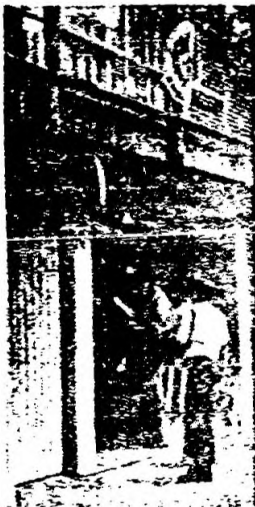
LA DELEGACION LLEGA A CALLE HEGEL 149

El miércoles 15 de Julio, una delegación del Movimiento Mexicano por la Paz, el Antimperialismo y la Solidaridad entre los Pueblos (MOMPAS) concurre a la sede de la embajada uruguayaya en Ciudad de México, sita en la calle Hegel 149, a efectos de entregar un petitivo de la libertad inmediata del general Liber Seregni. La delegación estaba acompañada por integrantes de la colectividad uruguayaya y por reporteros de la prensa y la televisión.