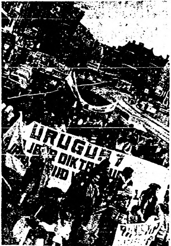
MANIFESTACION POR LAS CALLES DE AMSTERDAM EN EL 30 ANIVERSARIO DEL GOLPE DE ESTADO RECLAMANDO LA AMNISTIA GENERAL DE URUGUAY