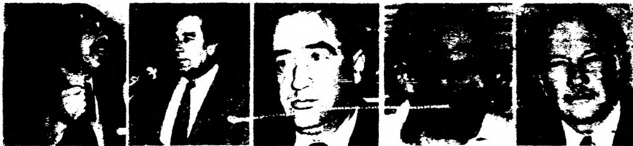
SEREGNI, WILSON FERREIRA, CARLOS JULIO PEREYRA, JORGE BATLLE Y AMILCAR VASCONCELLOS: CANDIDATOS A LA PRESIDENCIA Y A LA VICEPRESIDENCIA EN LAS ELECCIONES DE 1971. A LOS CUALES NO SE LES HA LEVANTADO LA INHABILITACION POLITICA. SEREGNI ESTA EN LA CARCEL Y FERREIRA EN EL EXILIO.