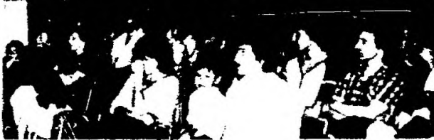
VISTA PARCIAL DEL CONGRESO DE EDUCADORES DE QUEBEC, QUE EXPRESO SU SOLIDARIDAD CON EL PUEBLO URUGUAYO