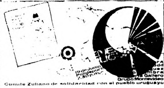
Comité Zuliano de solidaridad con el pueblo uruguayo