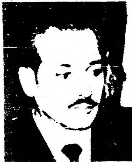
GERARDO CUESTA, SECRETARIO GENERAL DE LA CONVENCION NACIONAL DE TRABAJADORES DE URUGUAY.

En PARIS, al llamado de la Comision de Trabajo de la CNT en Francia y de los organismos politicos uruguayos y de solidaridad, se realizo el 22 de septiembre una manifestacion frente a la embajada de Uruguay, en repudio al asesinato de Gerardo Cuesta.