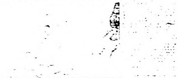
Apresentam-se para os comícios