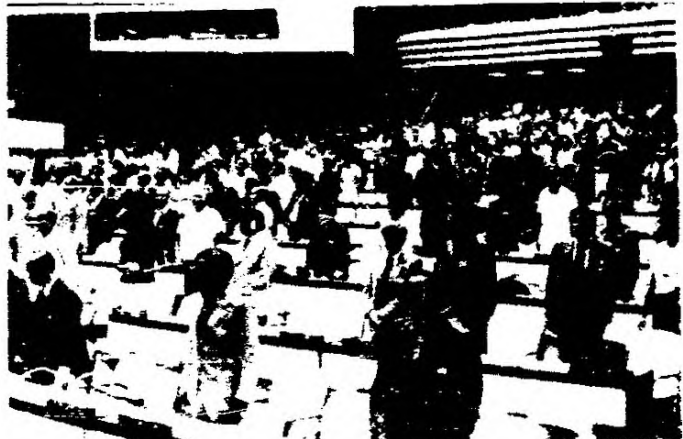
El Comité de Asesoría de la Conferencia Interparlamentaria, en una de sus reuniones, en la sede de la Conferencia Interparlamentaria en la Habana