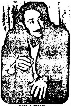
ORAL L. SEREGNI

La falta del régimen uruguayo para con este procedimiento militar, sólo puede explicarse en que Seregni fue uno de los