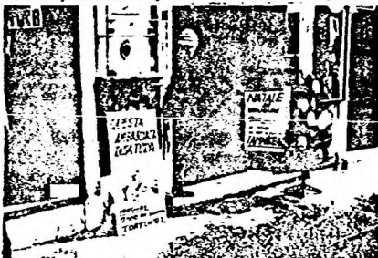
Este árbol de Navidad con alambres de púas, colocado frente a la embajada uruguaya en Roma, conmemoró a la Vía Veneto, con la denuncia de los presos y torturados.