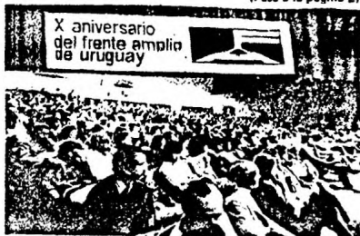
UN ASPECTO DEL PUBLICO EN EL ACTO CELEBRADO EN LA CIUDAD DE MEXICO EN EL 10º ANIVERSARIO DEL FRENTE AMPLIO.