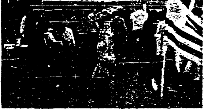
Solidarität mit den Völkern Lateinamerikas. Gedenken an Chile und Uruguay sowie die Österreichisch-Kubanische Gesellschaft sind beim Volksfest mit dabei.