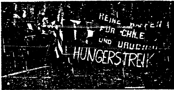
EL LEMA DE LOS DEMOCRATAS AUSTRIACOS: "NINGUN ARMA A CHILE Y URUGUAY".