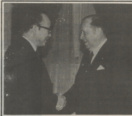
El verdugo del pueblo paraguayo, saludando al reverendo Sung Myun Moon, líder de CAUSA.

representante del nefasto régimen en nuestro país.