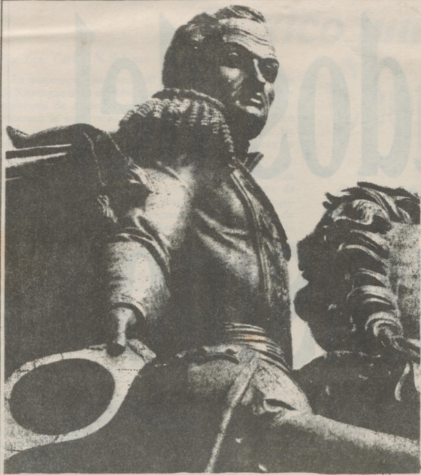
Estatua ecuestre del Libertador, en la Plaza Bolívar de Caracas.

En su discurso radiofónico semanal del sábado 16, el presidente Reagan tuvo la inaudita osadía de comparar las acciones de la canalla somocista —que con armas, dinero y mandos militares yanquis combate contra la revolución sandinista con la gente emancipadora de Simón Bolívar, el Libertador. Parece increíble, pero el facsimil no nos deja mentir. Como lo hizo en su discurso del 7 de febrero sobre el estado de la Unión, el presidente norteamericano vinculó la seguridad de Estados Unidos al respaldo que sigue brindando a la contrarrevolución armada, que calificó de “combatientes de la libertad” (con lo cual demuestra una vez más que, en su concepto, el régimen somocista era el paradigma de la libertad)