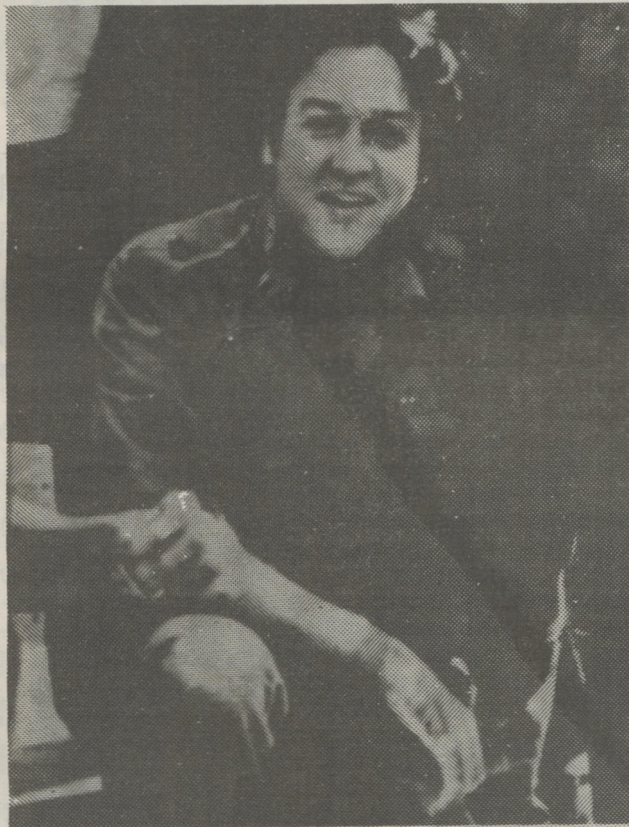
Comandante, Ministro de la Reforma Agraria, Jaime Wheelock

"Estas cifras dan una idea de la crisis en que se encuentra la ganadería bovina nicaragüense, tradicional pilar de la economía nacional. Ante esto, el gobierno sandinista considera prioritario la reorganización y desarrollo de esta actividad por dos aspectos fundamentales, por una parte, Nicaragua requiere de la entrada libre de divisas, siendo que la exportación de carne congelada ha desempeñado históricamente un relevante papel; por otra parte, la carne y la leche son dos alimentos básicos que constituyen objetivos nacionales para el mejoramiento de la dieta popular".