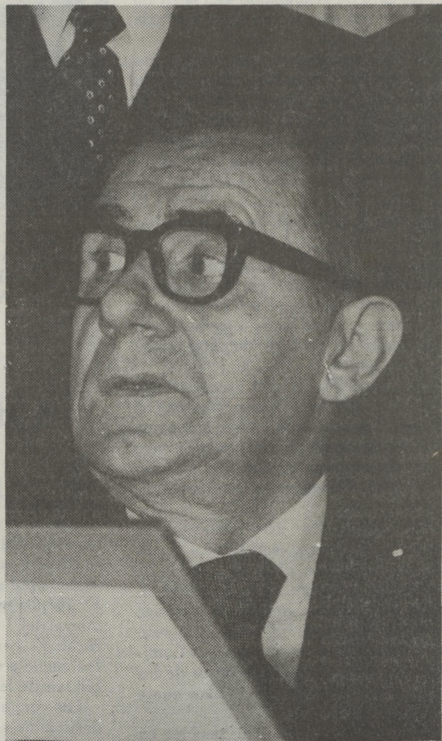
Andrei Gromyko, Ministro de Relaciones Internacionales de la Unión Soviética.

Respuesta: Si EE.UU. continúa emplazando en Europa sus armamentos nucleares de alcance medio, hay que decir sin rodeos que la situación irá agravándose. Y además mucho. Es bien sabido que propusimos congelar todos los stocks de armas nucleares. Más aún, en Ginebra advertimos claramente a Estados Unidos de América que de actuar de ese modo, de continuar desplegando ingenios nucleares de alcance medio —y ellos no dejan de destacar que éstos son sus planes, que sí se proponen llevarlos adelante—, pondrían en peligro las conversaciones que deben empezar conforme al acuerdo logrado en Ginebra. Repito, se lo hemos advertido a Estados Unidos. Esperamos que lo tenga en cuenta.