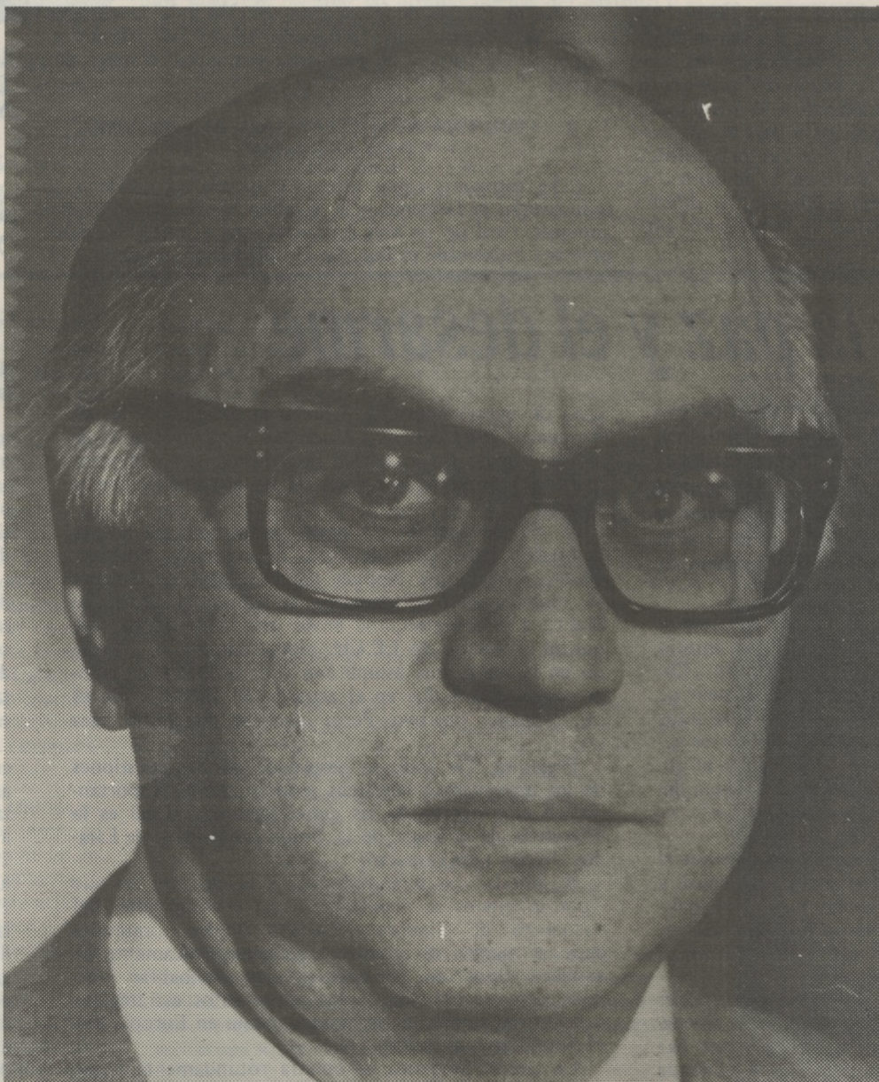
Ex ministro de Economía de Argentina, Bernardo Grinspun