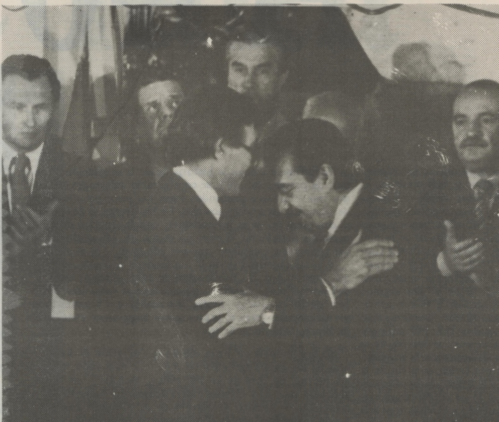
El presidente Raúl Alfonsín, abraza a Sourrouille tras prestar juramento.

Cierto es también que la "patria financiera" (un símil de la rosca uruguaya) que gobernó el país a gusto durante la dictadura militar, había emprendido en los últimos meses una feroz campaña contra Grinspun, que le valió al ministro —en ese contexto— el inopinado respaldo del ala izquierda de la Unión Cívica Radical, aglutinada en lo fundamental en la Junta Coordinadora Nacional de la juventud del partido, pese a que la crisis continuó agravándose y recayendo en lo fundamental sobre las espaldas de los trabajadores. Más allá de otras implicaciones de la lucha interna radical, los principales dardos de la Coordinadora, fundamentalmente a través de sus legisladores, estaban dirigidos contra el ex titular del Banco Central, García Vázquez (el otro relevado), que dilataba la reforma financiera prometida durante la campaña electoral, permitiendo que quedara intacto el andamiaje especulativo montado durante la dictadura, mediante el cual los grandes bancos acumularon fabulosas ganancias mientras el