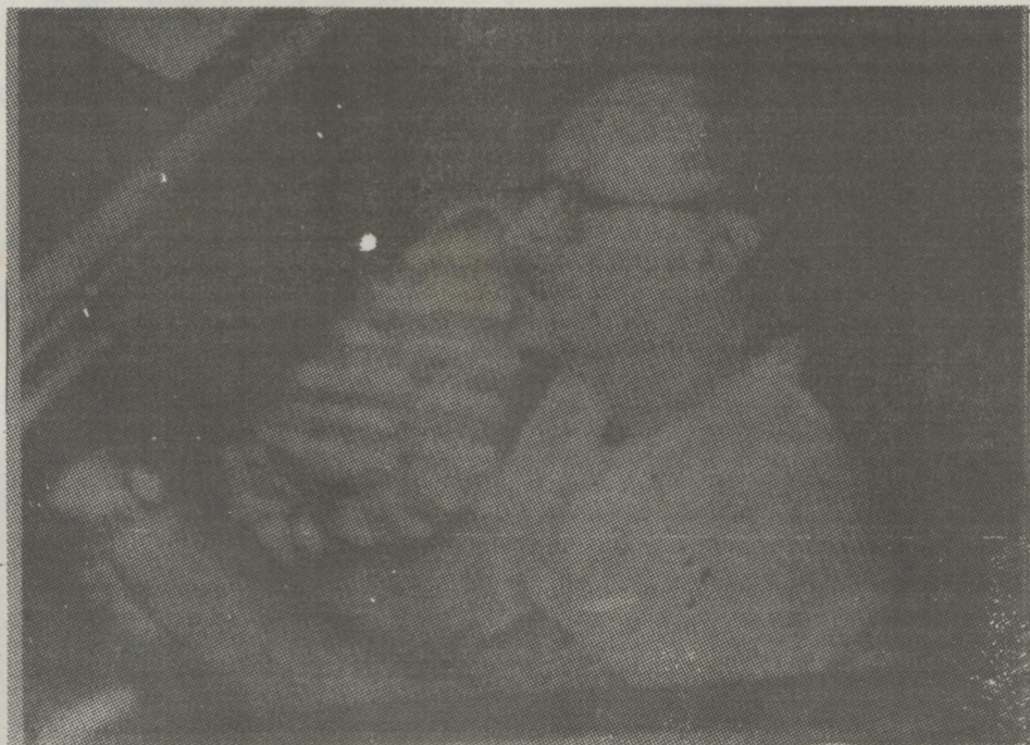
GENERAL RAMON CAMPS, ex jefe de policía de Buenos Aires, con

He ahí el retrato hablado de un típico profesional del anticomunismo.