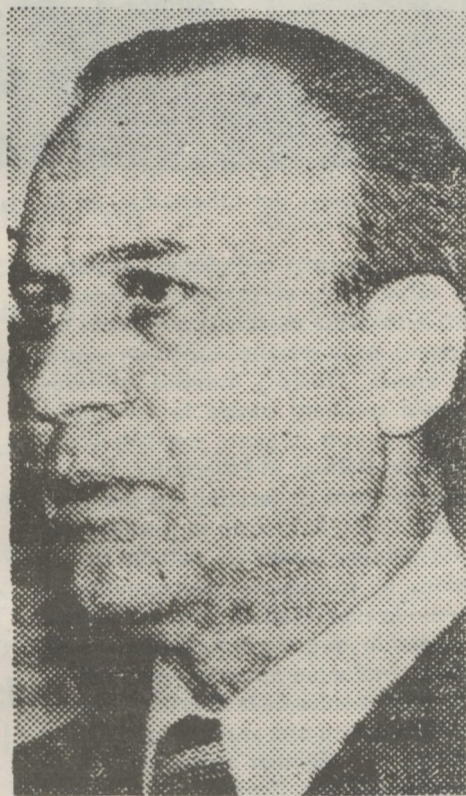
GENERAL DIAZ BESSONE, golpista argentino, participante en el aque- llar anticomunista de París.

En realidad, esta reunión complementa con la intervención militar y la represión policial el proyecto global lanzado por Reagan desde el Parlamento británico en 1983, propagandeadado bajo el rótulo de "Proyecto Democrático" y que incluye aspectos de propaganda y de infiltración en una serie de organizaciones a lo largo del mundo: partidos, instituciones, universidades, sindicatos, periódicos, etc. Este plan fue difundido por el secretario de Estado, George Shultz, y el director de la Agencia de Información de Estados Unidos, Charles Wick. Uno de sus ejes apunta a la penetración en el mundo socialista, con ribetes abiertamente provo-