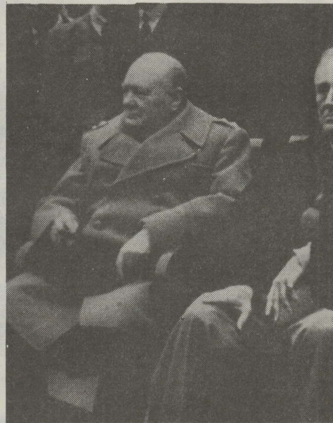
UNA FOTO HISTORICA: José Stalin, Franklin D. Roosevelt y Winston Churchill, reunidos en Yalta, Crimea, en febrero de 1945.

Cabe subrayar, como primer resultado, la condena al militarismo, el fascismo y la agresión contenida en el documento final de las tres potencias, que afirma: "Nuestro objetivo inexorable es liquidar el militarismo germano y el