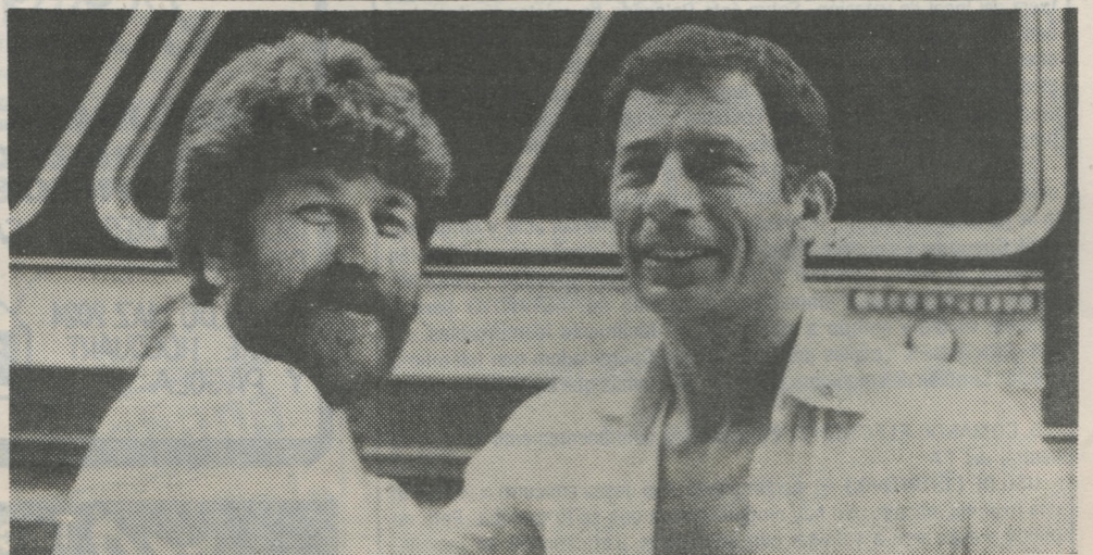
Un viajero que llega con su alegría y su voto para el Frente Amplio y un amigo que lo recibe.