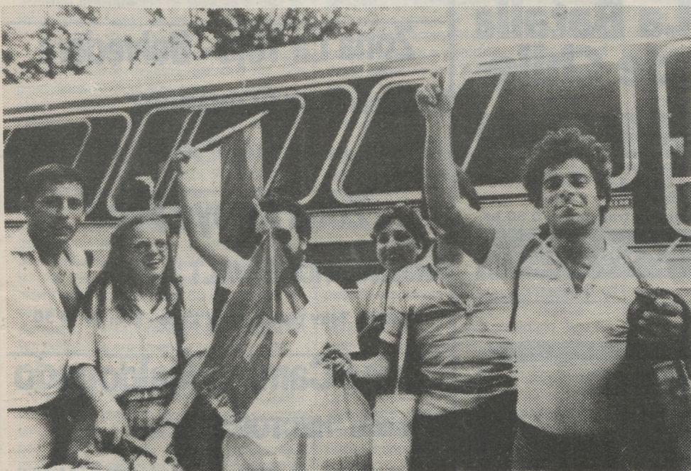
Las banderas son símbolos elocuentes de las preferencias de los viajeros que llegaron del Brasil: votan al F.A.