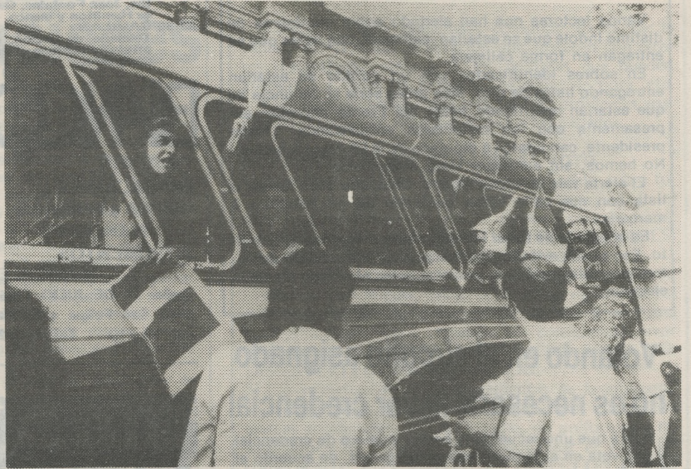
El ómnibus llega desde Brasil (Porto Alegre) con viajeros votantes del F.A. Las banderas desplegadas así marcan. El retorno, también es un río humano en busca de la libertad, la paz, la justicia social y la democracia.