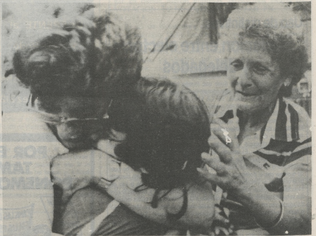
El abrazo de los parientes en el esperado retorno. La madre abraza a la hija y la abuela extiende sus brazos para completar el cuadro del retorno. Un voto más para el Frente Amplio.