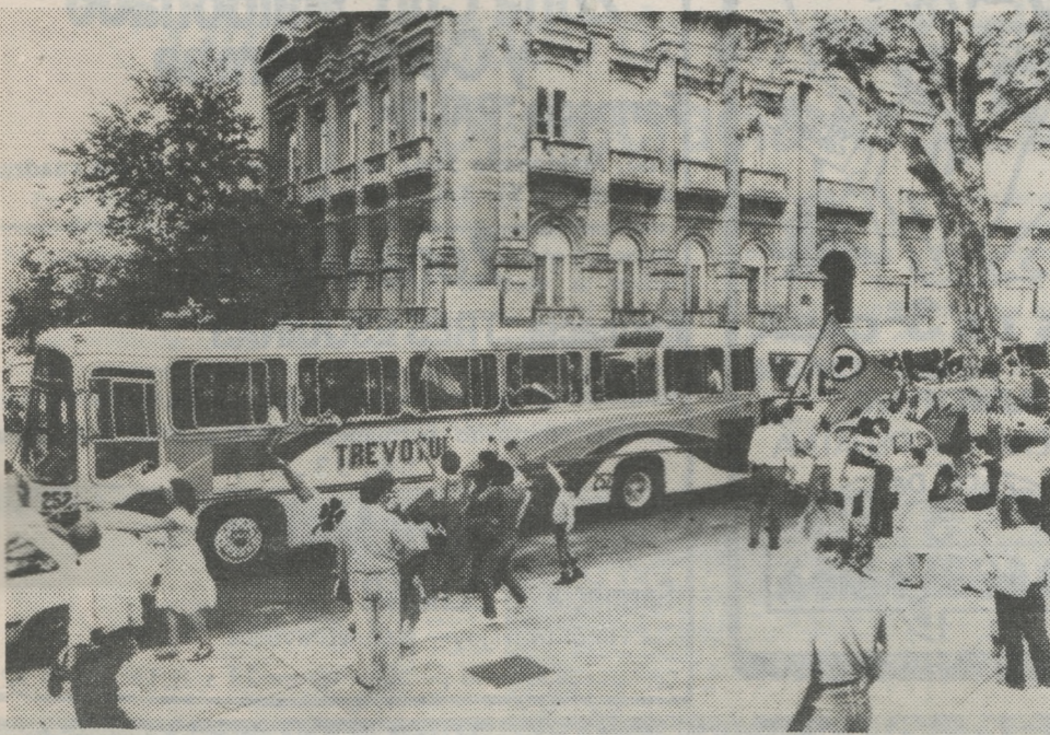
Dos ómnibus que llegaron a la Plaza Libertad luego de recorrer miles de kilómetros para traer uruguayos que votan en su mayoría por el F.A.