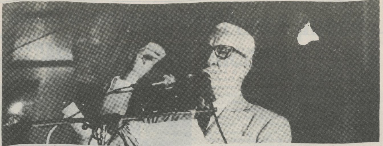
Crotogini: Votar por la libertad, por la democracia y la paz, para asegurar el triunfo en Montevideo y hacerlo extensivo al resto del país."

Con ese espíritu es que vamos a abordar estos días que nos quedan, con ese espíritu compañeros, es que los convoco a ustedes. Siempre terminamos nuestras palabras con una afirmación, y hoy, después de ver este acto, y de que tuvimos el privilegio de ver, repito, este río de lucecitas, que iban bajando hasta Galicia y remontando luego hasta el Palacio Legislativo, no tenemos ninguna duda, qué gran fuerza política es nuestro Frente Amplio. Vamos firmes, concientes, seguros, tranquilos a la lucha comicial del 25 de noviembre. Vamos a la lucha y con alegría, vamos a la lucha, continuando desde ya lo que es este festejo y esta celebración, que continuaremos en la noche del domingo 25. Compañeros frenteamplistas, me preguntaban hoy en una audición de radio si yo tenía orgullosos, y sí, yo dije que tenía dos tremendos orgullosos: el orgullo de pertenecer a este pueblo, el orgullo de ser oriental, de este pueblo que ha realizado las proezas que realizó durante todos estos años, y el segundo orgullo de ser frenteamplista, compañeros, de ser integrante de esta fuerza tremenda que cambiará nuestro país. Con este orgullo, con esta convicción es que repetimos una vez más: el futuro es nuestro, compañeros, venceremos compañeros, el Uruguay va, y va de Frente, compañeros.