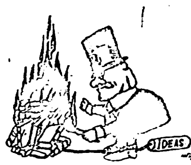
Caricatura acerca del ministro Narancio publicada por el diario cubano "Granma"

P OCAS VECES la oligarquía habló tan claro. Su apetito es voraz. Pero el hueso se le va a quedar en la garganta. La CNT nació para quedarse. Tras estas declaraciones gorilas, los trabajadores redoblarán su lucha y refortarán aún más sus organizaciones clasistas. En el paro general que se ha convocado tendrá Bordaberry la mejor respuesta. Si hay alguien que está de más, mal pueden ser los trabajadores porque sin ellos no hay nación. El que está de más es Bordaberry. Fuera con él, abajo la dictadura!