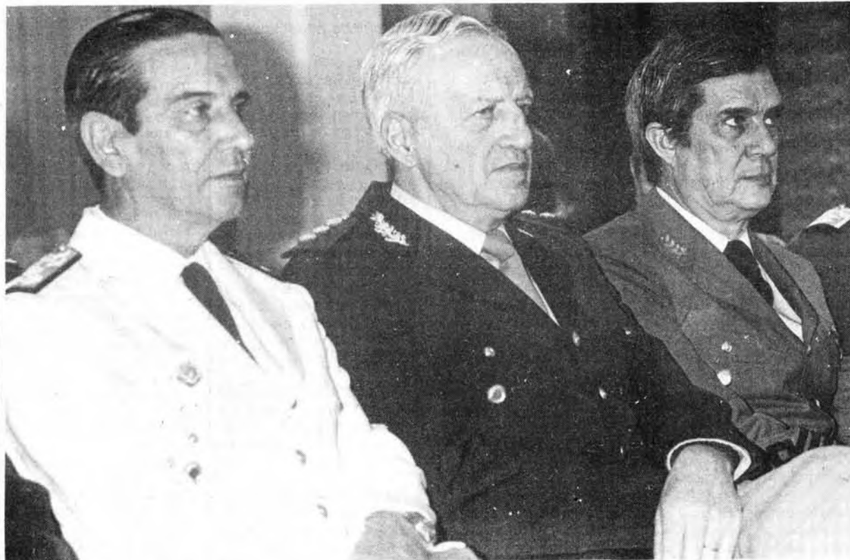
Pedido fiscal: doce años de prisión para Galtieri y Anaya; ocho para Lami Dozo y la destitución de los tres.