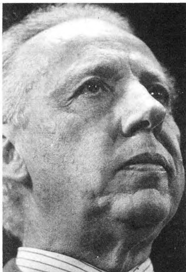
Italo Argentino Luder firmó los decisivos decretos.

Por su importancia histórica y para una mejor comprensión de algunos pasajes del juicio a los ex comandantes, reproducimos textualmente los decretos de Luder del 6 de octubre de 1975.