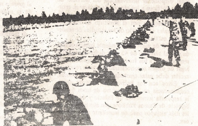
La presencia militar estadounidense en Centroamérica, decidida por el presidente Ronald Reagan, continúa siendo el principal obstáculo para que se logre la paz en esa convulsionada región